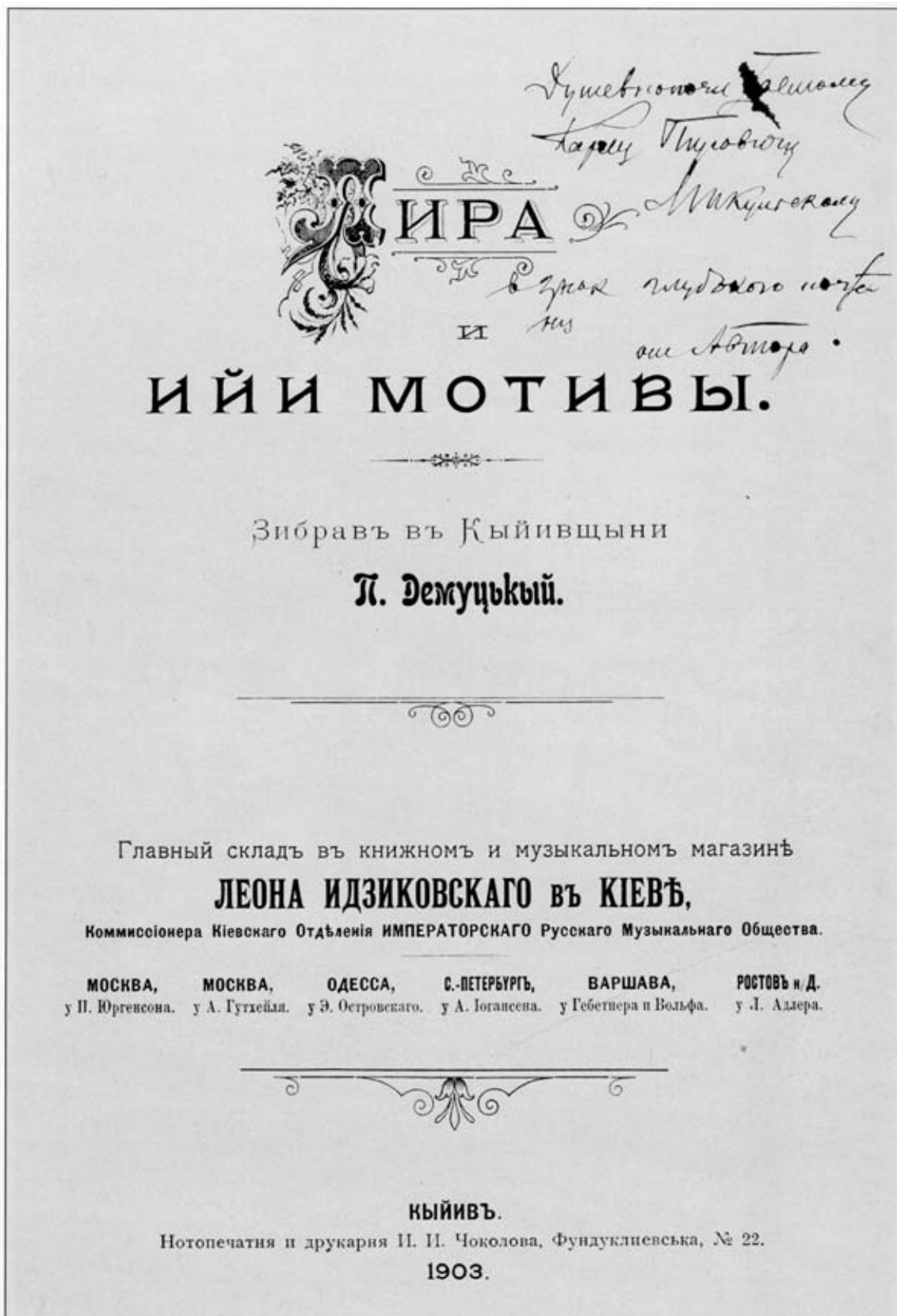
Титульна сторінка книги «Ліра і її мотиви» з дарчим підписом Порфирія Демущького Карлу Мікульському. м. Київ. 1903 р.