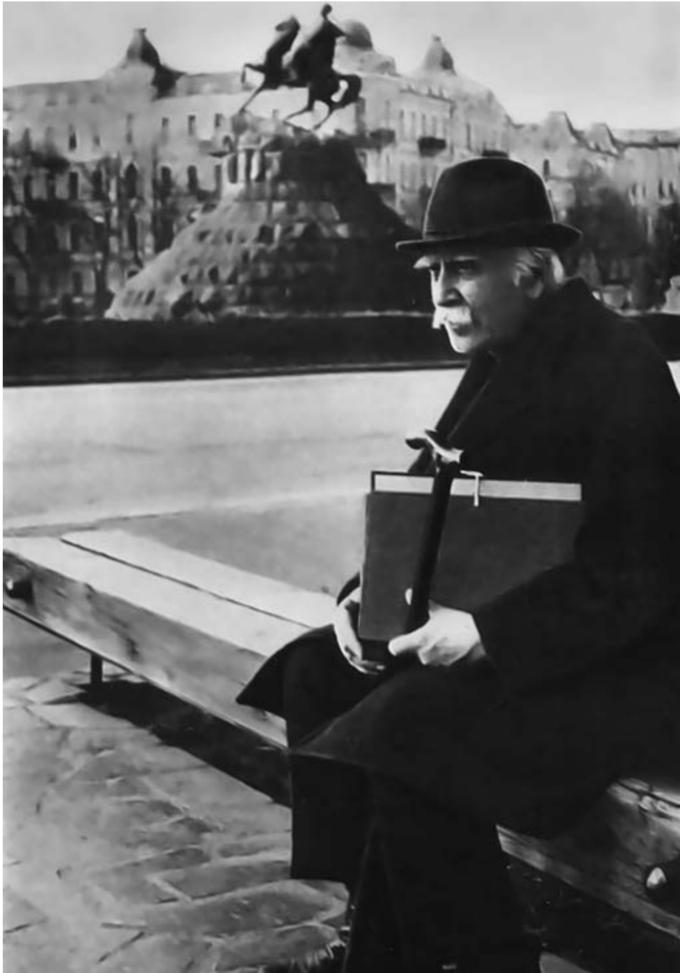
Л. Ревуцький у колишньому Історичному сквері на площі Б. Хмельницького. Київ. 1973 р.