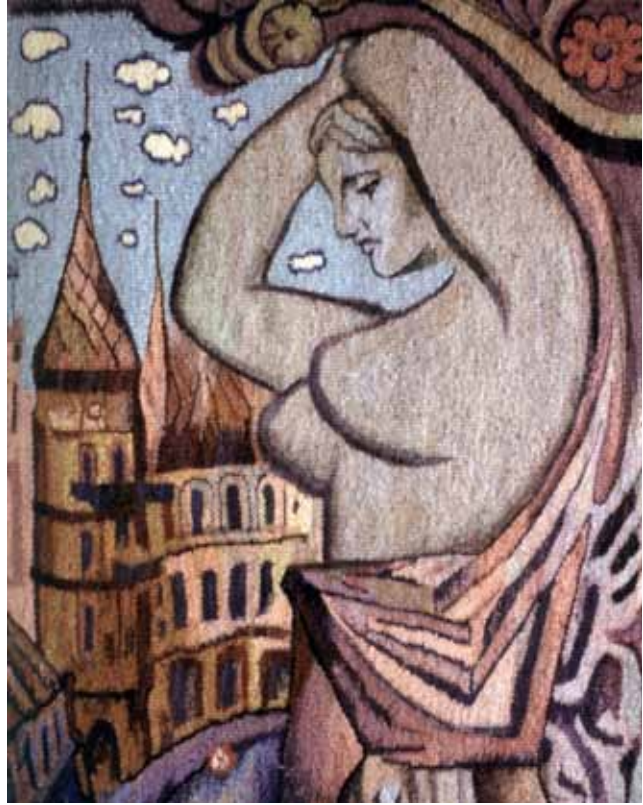
«Ярославів вал. Київ». 2004 р.