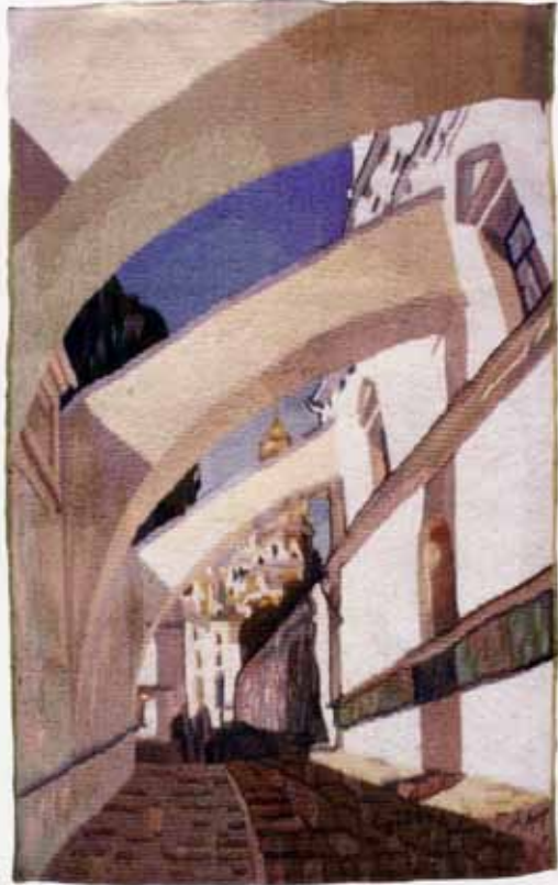
«Лаврські аркбутани». 2004 р.