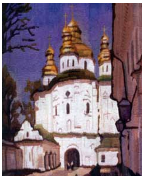
«Церква Всіх Святих на економічних воротах. Києво-Печерська лавра». 2004 р.