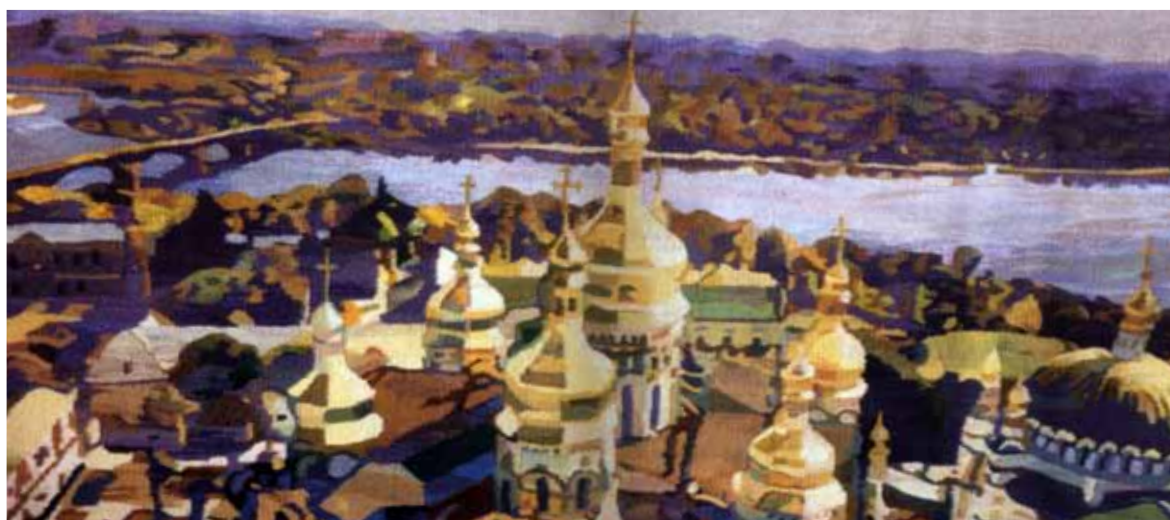
«Панорама з Лаврської дзвіниці». 2004 р.