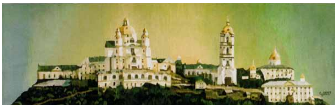
«Світанок. Почаївська лавра». 2007 р.