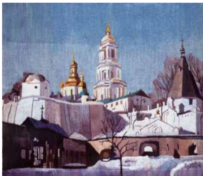
«Зимовий ранок. Вхід до Києво-Печерської лаври». 2004 р.