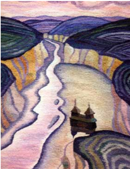
«Смотрич. Кам'янець-Подільський». 2002 р.