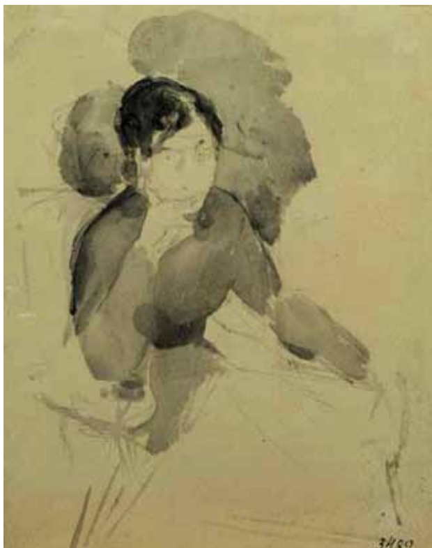
Михайло Врубель. Портрет молодої жінки *. 1885 р. Папір, чорна акварель