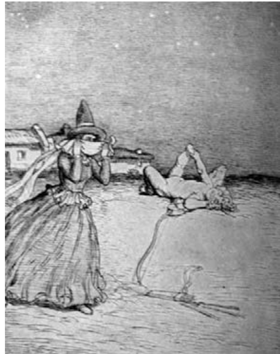
Купідон. 1921 р.