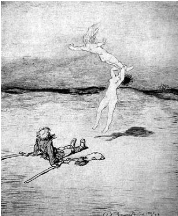
«Навождение». 1921 р.