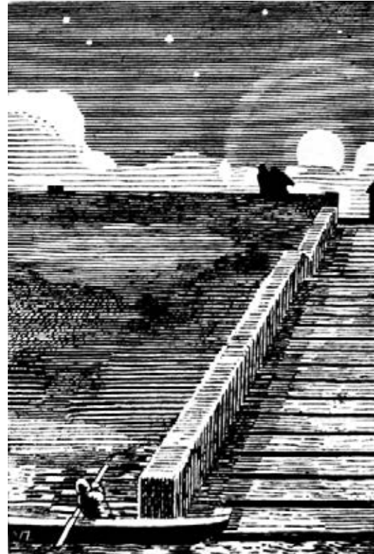
Буря. 1931 р.