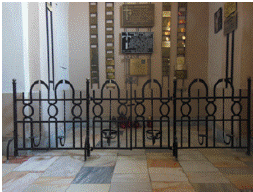
Іл. 3. О. Бойков . Декоративна перегородка. Костел Царя Христа. м. Івано-Франківськ. 1992 р.