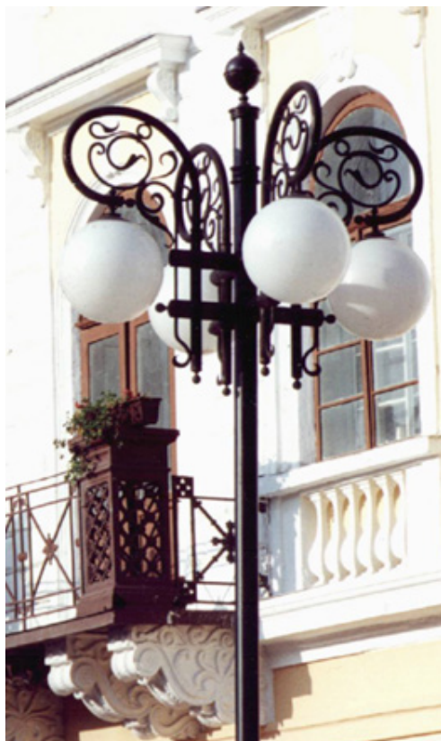
Іл. 1. О. Бойков . Ліхтар. Костел Царя Христа. м. Івано-Франківськ. 1992 р.