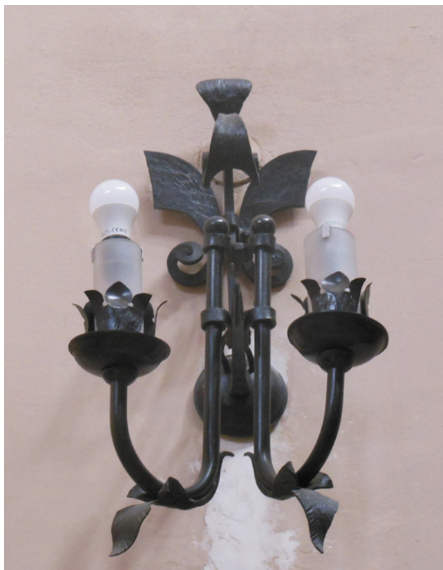
Іл. 2. О. Бойков . Світильник-бра. Костел Царя Христа. м. Івано-Франківськ. 1992 р.