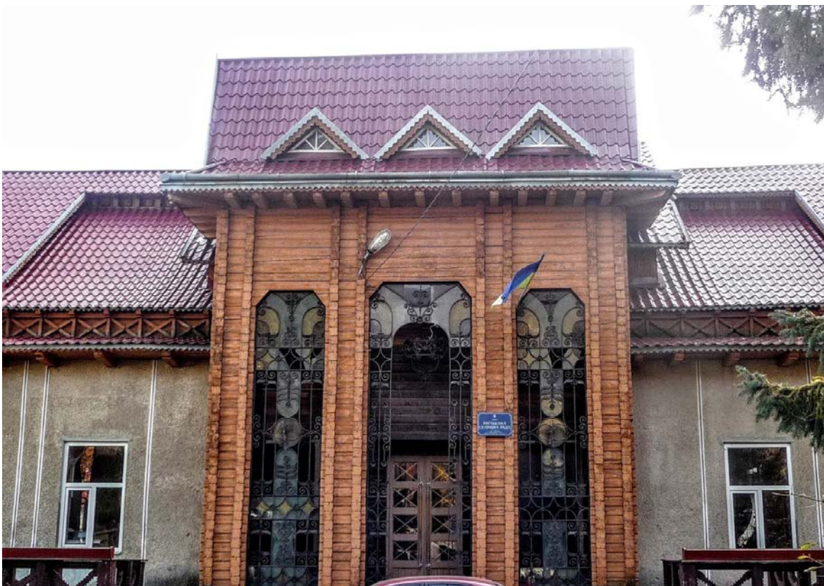
Іл. 5. О. Бойков. Ковані елементи (віконні решітки, люстра над входом) порталу будинку селищної ради смт Вигода Долинського р-ну Івано-Франківської обл. 1987 р.