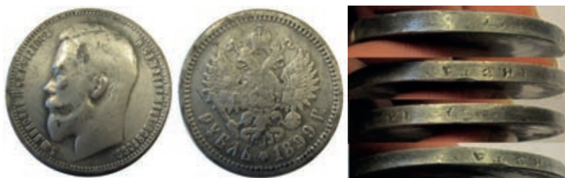
Рис. 12. НМВ. Російська імперія. Тогочасна підробка рубля зразка 1899 р. Инв. NPO 169818; вага 17,63 г.; розмір 34,42 мм