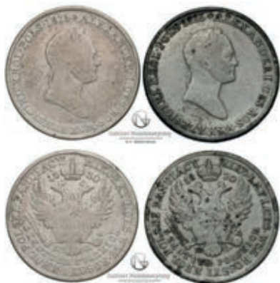
Рис. 7. Царство Польське, 5 злотих 1830 р. державного зразка та виконана за прототипом цієї монети тогочасна підробка з олова