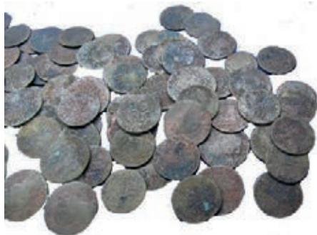
Рис. 4. БДУ. Скарб тогочасних підробок монет Царства Польського номіналом 10 грошів 1840 р. Инв. № 4958-5440