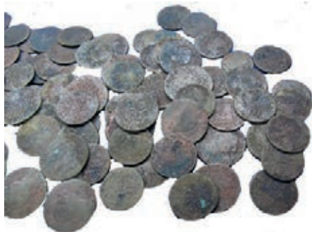
Рис. 4. БДУ. Скарб тогочасних підробок монет Царства Польського номіналом 10 грошів 1840 р. Інв. № 4958-5440