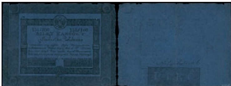
Рис. 8. Фальшиві 5 злотих зразка 1824 р. Серія А 1315160

2-злотовок), Міністерство фінансів Австрійської імперії від 2 листопада 1858 р. заборонило прийом у місцевих касах російських грошей 42 .