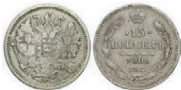
Рис. 15. Фальшиві 15 коп. 1905 р., вага 2,38 г