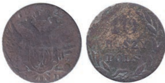
Рис. 3. Тогочасна підробка 10 грошів із датою «1829». Знайдено в Ізяславському р-ні Хмельницької обл. Приватна колекція м. Київ. Розмір 18,24 мм. Вага 1,89 г

В процесі дослідження знахідок фальшивих монет за прототипом 10 грошів нам вдалось також виявити монету із датою «1829», коли свідчень про карбування монет в цей рік у нумізмічних каталогах немає. Припускаємо, що виявлена монета є тогочасною підробкою із фантазійною датою (Рис. 3).