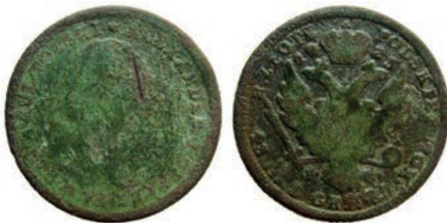
Рис. 2. Тогочасна підробка 1 золотого зразка 1823 р. Знайдено в околицях с. Згинці, Деражнянський р-н Хмельницької обл. Приватна колекція м. Київ. Розмір 25,68 мм. Вага 7,13 г

Згаданий архівний фонд містить цікаві відомості про особливості проведення слідства над фальшивомонетниками. 29 грудня 1845 р. секретним циркуляром Міністерства внутрішніх справ було повідомлено Департамент поліції про необхідність надання такого розпорядження всім громадянським та поліцейським керівництвам відомств: у разі виявлення сумнівних банківських білетів не затримувати одразу підозрюваного для допиту, а лише довідатися, звідки отримано фальсифікат і чи готова особа надати підозрілі гроші на експертизу до Правління Асигнаційного Банку, а повноцінні слідчі дії розпочинати вже після доведення експертами, що асигнація справді підроблена 23 . Натомість маємо протилежний приклад у Київській губернії – 22 жовтня 1909 р. київський губернатор наказав Фастівському відділенню Київського жандармського поліцейського управління залізниць перевіряти всіх пасажирів та покупців білетів у касах за найменшої підозри на фальшивість наданих ними кредитних білетів та монет 24 .