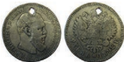
Рис. 9. НМВ. Російська імперія. Тогочасна підробка рубля зразка 1892 р. Інв. № NPO 169793; вага 14,19 г; розмір 33,52 мм