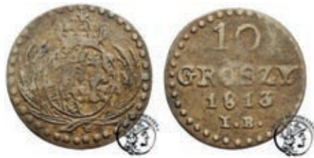
Рис. 1. Фальшиві 10 грошів зразка 1813 р.

На особливу увагу заслуговують продані на нумізматичному аукціоні Павла Немчика фальшиві 10 грошів зразка 1813 р., виготовлені за прототипом російських імперських монет, карбованих для обігу в Царстві Польському (одні з перших російсько-польських монет, рис. 1) 13 .