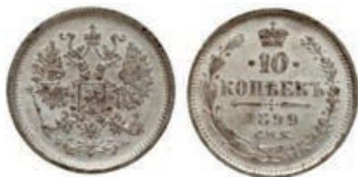
Рис. 14. Фальшиві 10 коп. 1899 р., вага 1,56 г

«Підроблені півімперіали. Згідно з повідомленнями варшавських газет, у м. Варшаві з'явилась значна кількість підроблених півімперіалів. Монети виконані досить мистецьки, мають відповідну вагу та лише дзвоном відрізняються від справжніх» 57 .