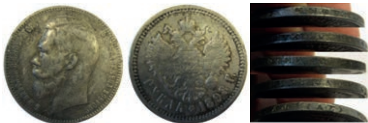
Рис. 11. НМВ. Російська імперія. Тогочасна підробка рубля зразка 1898 р. Инв. NPO 169810; вага 15,14 г; розмір 33,75 мм