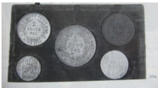
Рис. 5. Патріотичний набір учасника Польського повстання 1831–1832 рр. GM Giessener Münzhandlung Dieter Gorny. Auktion 72. Donnerstag, den 4. Mai. München, 1995. Lot 3754

Повстання 1830–1831 рр. призвело до глибокого соціального потрясіння, прагнення польського народу до незалежності від Російської імперії відійшли у підпілля, а викарбувані за той час монети стали символом боротьби, як, наприклад, збережений набір монет у спеціальній коробочці (Рис. 5) – імітація голландського дуката 1831 р., срібні монети номіналом 5 та 2 злотих, дрібні розмінні монети номіналом 10 та 5 грошів, а також касовий білет в 1 злотий 1831 р. Набір був проданий на 72 аукціоні «Giessener Münzhandlung Dieter Gorny» 1995 р. 35