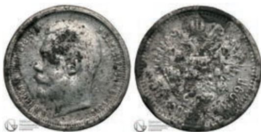
Рис. 16. Фальшиві 50 коп. 1899 р., вага 8,28 г