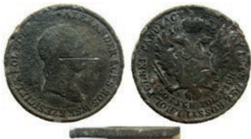
Рис. 6. Тогочасна підробка 5 злотих зразка 1829 р. Знайдено в околицях Львова. Приватна колекція, м. Київ. Розмір 31,44 мм. Вага 11,73 г