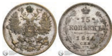
Рис. 17. Фальшиві 15 коп. 1914 р., вага 2,53 г

Зразки фальшивих монет та банкнот, які є німими свідками подій Першої світової війни, відомі і на колекційному ринку. Нумізматичний аукціон «Gabinet Numismatyczny D. Marciniak» декілька разів виставляв на продаж підробки: 15 коп. 1914 р. (Рис. 17) 74 , 50 польських марок 1916 р. 75 , а також фальшивий рубль для м. Лодзь 1915 р. 76 .