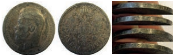
Рис. 10. НМВ. Російська імперія. Тогочасна підробка рубля зразка 1896 р. Інв. NPO 169801; вага 14,52 г; розмір 33,68 мм