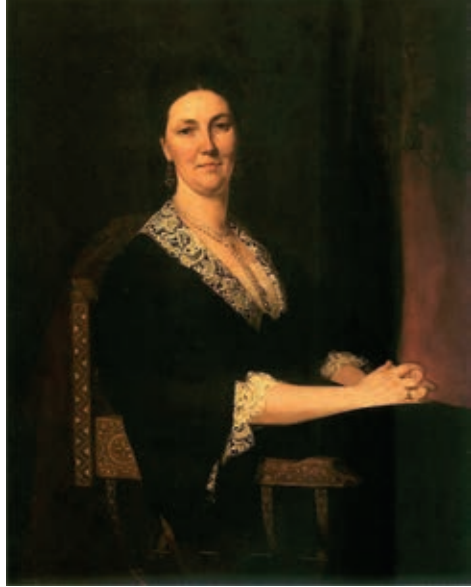
Альфонсина Дзедушицька. Портрет Генрика Родаковського, 1876 р. Оригінал зберігається у Львівській картинній галереї

листа була дуже зверхньою щодо українців: «А русини? То тільки пастухи і парубки! ... То ми магнати, то ми шляхта, то ми провідники, то ми сила, потуга. Ви дали себе за чоло взяти ..., по ваших дворах і фільварках вигодуваним пастухам і парубкам?! У це неможливо повірити. То тільки та наша найдурніша в Європі шляхта польська ... По столітній неволі ми нічого не навчилися, нічого не згадали, самі по дворах виховуємо гайдамаків! Щоб нас стріляли, як зайців» 46 . У деяких жіночих текстах можна зустріти наділення русинів негативними рисами й намагання підкреслити вищість поляків за їхній рахунок. Загалом така риторика була характерна для медійних практик польських націонал-демократів, отож, зважаючи на те, що найбільшими їхні впливи були саме серед польської львівської інтелігенції, не дивно, що такі нотки лунали саме у виконанні жінок із цих середовищ.