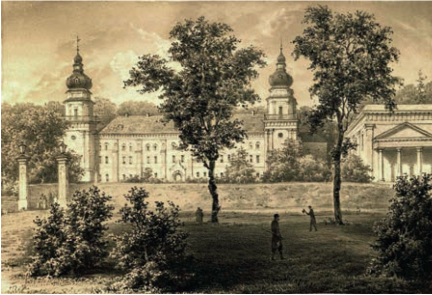
Палац у Ланьцуті, родинне гніздо Потоцьких у Галичині. Літографія Наполеона Орди

світу до нецивілізованого сходу. Польська шляхта була в його очах «варварським класом людей, які намагалися тут, на Русі, продовжити своє панування», були малоосвіченими, лише копіювали європейців, дивно змішували революційність і ретроградний консерватизм. Русини ж здавалися йому «допотопними з'явами», серед яких можна було вивчати життя європейських народів з каролінгських часів.