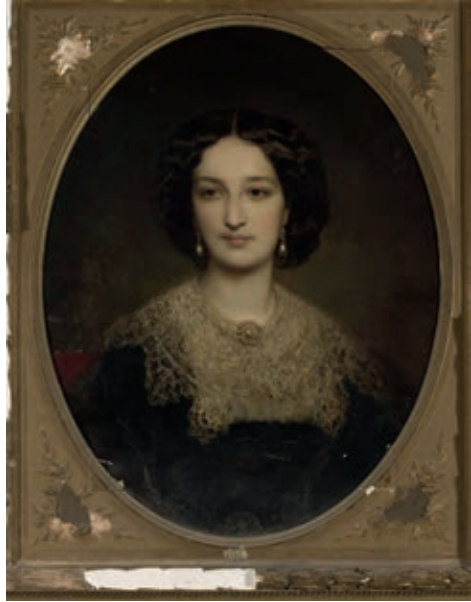
Катажина з Браницьких Потоцька. Портрет Луї-Густава Рікарда, 1855 р. Оригінал зберігається в Національному музеї у Варшаві

Основними респондентами для дорослої жінки ставали її батьки, сестри, меншою мірою – брати, чоловік за його відсутності вдома, згодом – дорослі діти, а пізніше й онуки. Так, у родинях Потоцьких і Дзедушицьких написання листів до бабусі, особливо якщо вона овдовіла, вважалось обов'язком і ознакою доброго тону змалечку. Жінки старші або ж хворі іноді призвичаювалися диктувати листи помічницям; ті ж часом за дорученням або й від власного імені (здебільшого коли бачили, що їхні пані потребують більшої підтримки, ніж це показують) вступали