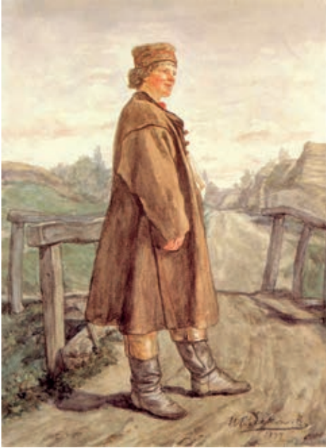
Український селянин. Портрет Генрика Родаковського, 1877 р.

Оригінал зберігається в Національному музеї у Вроцлаві