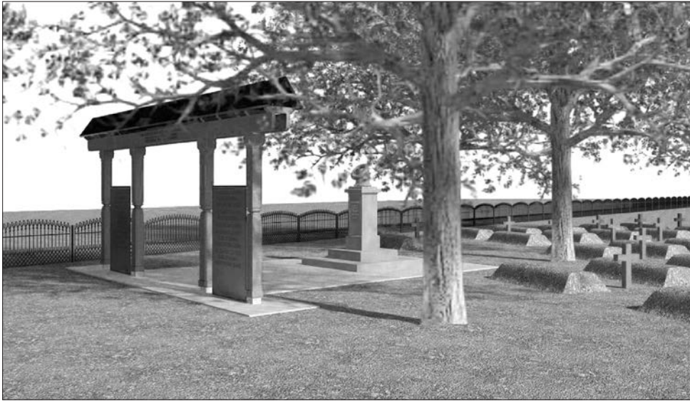
Проект відновлення цвинтаря у Глибівці