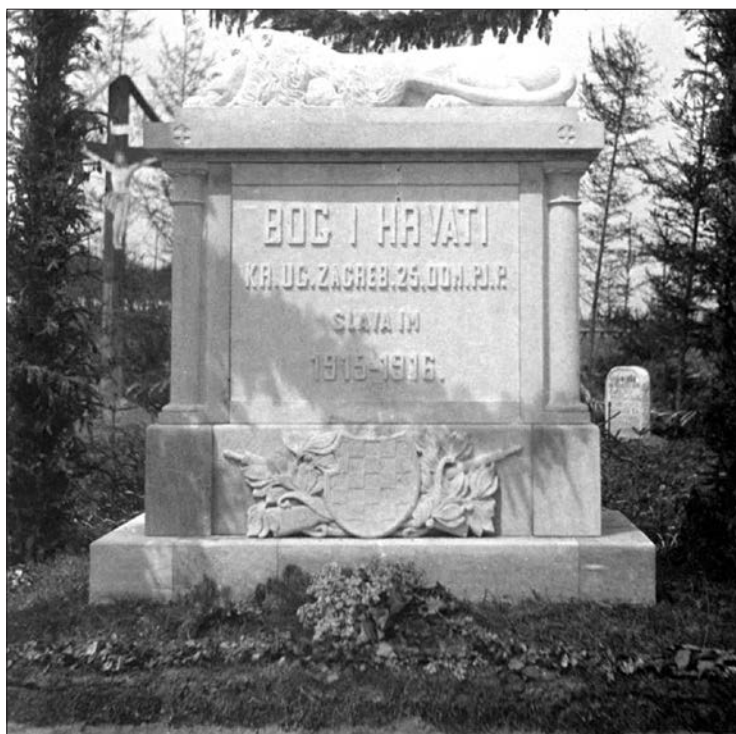
Пам'ятник хорватам в с. Кулачківці біля Коломиї (фото 1920-х років)