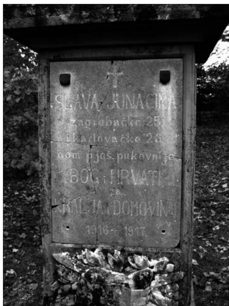
Сучасний вигляд пам'ятника і цвинтаря в с. Глибівка