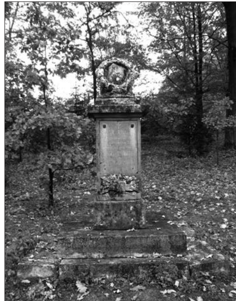
Сучасний вигляд пам'ятника і цвинтаря в с. Глибівка