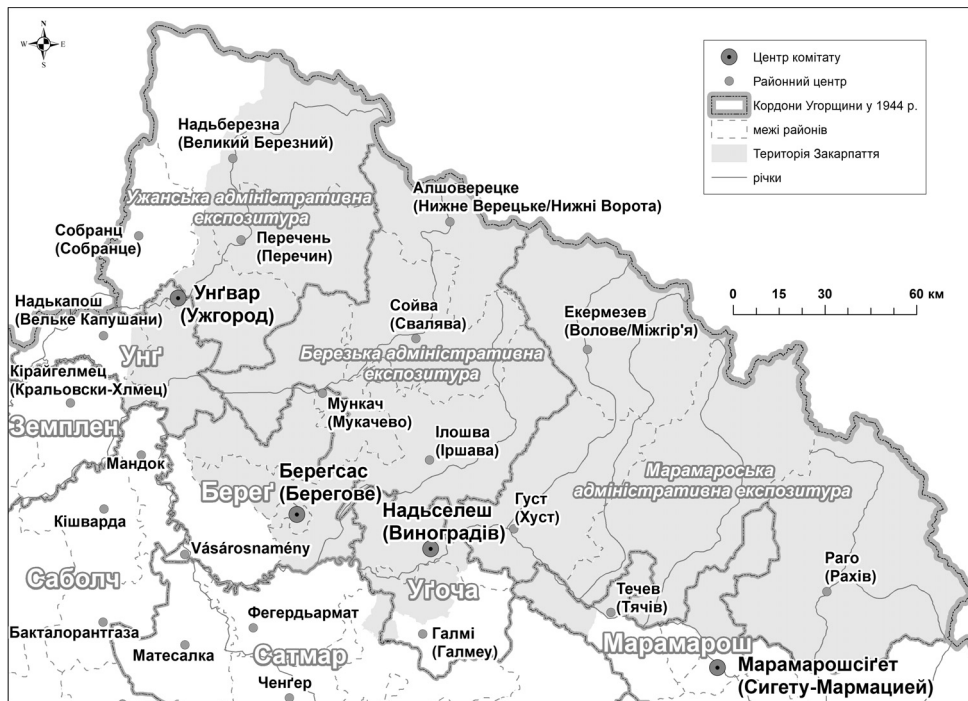
Рис. 2. Адміністративно-територіальний поділ території Закарпаття у 1944 р. 45

що відповідало межам районів угорського періоду 46 . Згодом, у ході розмежування кордонів, Великоберезнянський р-н розділили на дві частини: 31 населений пункт увійшов до Закарпатської обл., а 34 – відійшли Чехословаччині. Марамороський р-н передали Румунії. Західні межі області також не збігалися з кордонами комітатів 1938 р. – їх значною мірою посунули у сторону заходу, тож важливий залізничний вузол Чоп теж став частиною Радянського Союзу. Для радянської влади важливим було й те, щоб залізнична лінія Чоп–Ужгород також належала до Закарпаття, тож зі стратегічних міркувань території завширшки 6–8 км на захід від залізничної лінії приєднали до Закарпатської обл. Чехословаччина віддала Радянському Союзу землі площею приблизно 250 км 2 – це 11 населених пунктів (Батфа, Малі Селменці, Паладь-Комарівці, Галоч, Соломонове, Сюрте, Ратівці, Палло, Чоп, Тийглаш, Тисаашвань). Лінія кордону від Соломонова до Палло простягнулася по прямій, при цьому не зважили навіть на те, що с. Селменці довелося розділити на дві частини – Малі та Великі. 3 4 квітня 1946 р. с. Лекаровце передали Чехословаччині – так лінія кордону з північно-східною дугою простяглася далі у сторону Ужгорода 47 .