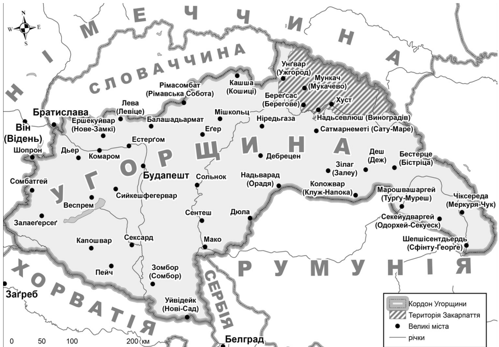
Рис. 1. Територія Закарпаття у складі Угорщини в 1944 р. 44

Зміни в адміністративно-територіальному устрої. До осені 1944 р. на території Закарпаття функціювала створена в Угорському Королівстві адміністративно-територіальна система (Рис. 1). Відповідно регіон складався з чотирьох комітатів (Ужанського, Березького, Угочанського, Марамороського) та трьох адміністративних експозитур: Ужанської, Березької і Марамороської (див. рис. 2).