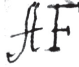
Рис. 5. Торговий знак-аббревіатура Артура Форбса