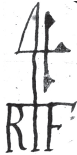
Рис. 3. Торговий знак Роберта Форбса (Robert Forbes) із символом «4» та його ініціалами. Варіант 1