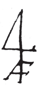
Рис. 2. Торговий знак Артура Форбса із символом «4» та його ініціалами