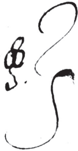
Рис. 8. Торговий знак, складений за допомогою трьох кругів і хвилястої ніжки-основи, його власник невідомий. Варіант 1