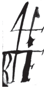
Рис. 4. Торговий знак Роберта Форбса із символом «4» та його ініціалами. Варіант 2