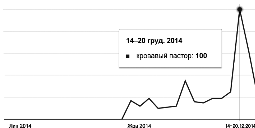
Рис. 2. Динаміка зміни інтересу за пошуковим терміном у програмі Google Trends

Отож, виокремлені особливості нової громадської дипломатії створили основу для формулювання певних рекомендацій для її учасників у сучасних умовах. Насамперед потрібно використовувати потенціал і нових, і старих технологій, поєднуючи їх розумно. Високий рівень довіри та позитивна репутація учасників ГД сприяють створенню ефективних мереж на добровільних засадах, що дає змогу вчасно реагувати на зміни, максимально розширювати свою присутність та зменшувати кількість задіяних ресурсів. Окрім того, потрібно постійно моніторити інформаційний простір з метою виявлення вірусного контенту, його подальшого використання на свою користь, а також протидії ймовірним супротивникам.