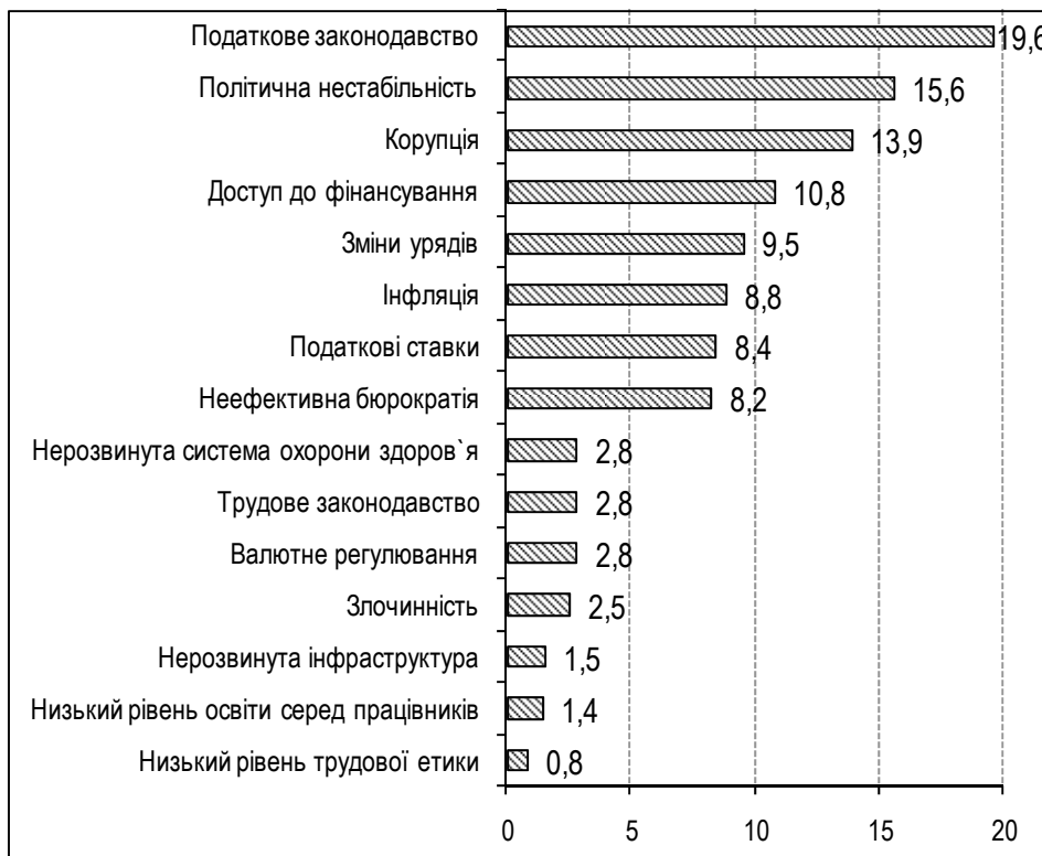
Рис. 1. Чинники, які перешкоджають веденню бізнесу в Україні (за результатами опитувань українських підприємців) [5]

чене населення, гнучкий та ефективний ринок праці, перспективний за обсягами внутрішній ринок.