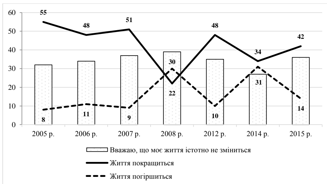
Рис. 4. Динаміка розподілу відповідей респондентів на запитання: «Незабаром Новий рік. З якими настроями Ви зустрічаєте його?», %