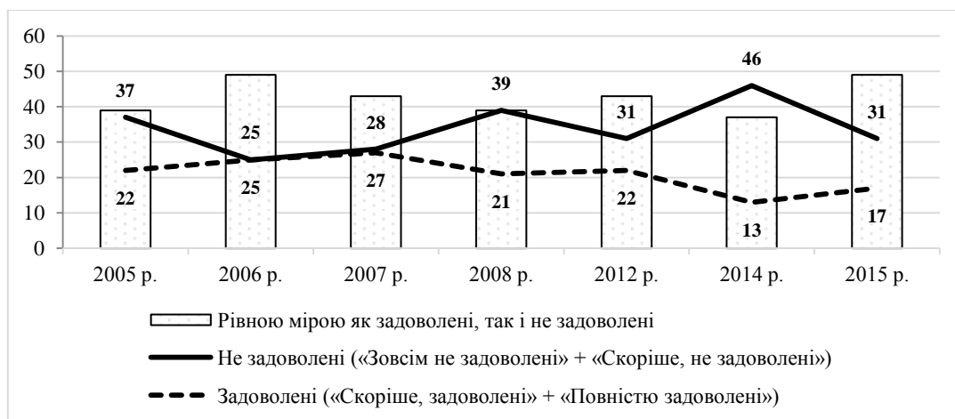
Рис. 3. Динаміка розподілу відповідей респондентів на запитання: «Наскільки Ви задоволені тим, як складалося Ваше життя у році, що минає?», %

Аналіз відповідей за останні 10 років показує, що лише у 2006 та 2007 роках серед українців були однаковими частки незадоволених та задоволених. У кризовий 2008 р. стрімко збільшилася частка незадоволених, вона зменшилася тільки у 2012 р. У 2014 р. ми спостерігали найнижчі оцінки, сьогоднішні оцінки є дуже схожими на ті, що були у 2008 р.