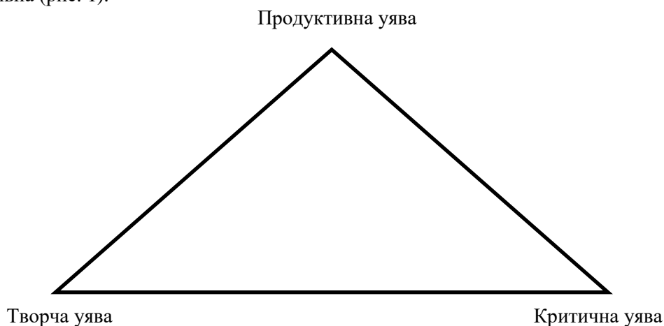
Рис. 1. Тріада уяви фахівців територіальних центрів соціального обслуговування населення про потреби осіб похилого віку

Ми посилаємося на характеристики уяви фахівців у сфері соціальної роботи, представлені як тріада, що складається з таких видів уяви, як творча, критична, продуктивна (рис. 1).