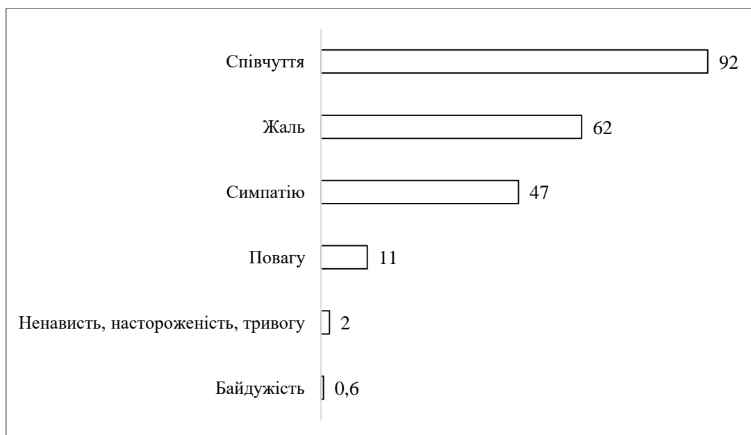
Рис. 2. Відповіді експертів на запитання: “Які емоції переважно викликають у Вас люди похилого віку?”, N = 535, %*

Особи похилого віку на емоційному рівні у опитаних фахівців у сфері соціальної роботи (незалежно від їх гендерних, вікових ознак, освітнього потенціалу, місця проживання) викликають переважно позитивні емоції, що налаштовує їх на виконання своїх професійних обов'язків. Домінують такі три емоції: співчуття (92%), жаль (62%) і симпатія (47%). Ще 11% вказали, що літні люди викликають у них повагу. Близько 2% відчують до цієї групи клієнтів ненависть, настороженість, тривогу. Менше ніж один відсоток респондентів зазначили, що вони байдужі до осіб похилого віку, які їх мало цікавлять як отримувачі соціальних послуг (рис. 2).