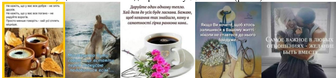
Рис. 2. Тема любові

Наступною за значенням для користувачів українського сектору соціальних мереж є тема любові, що знайшла своє відображення у 38% постів (рис. 2).