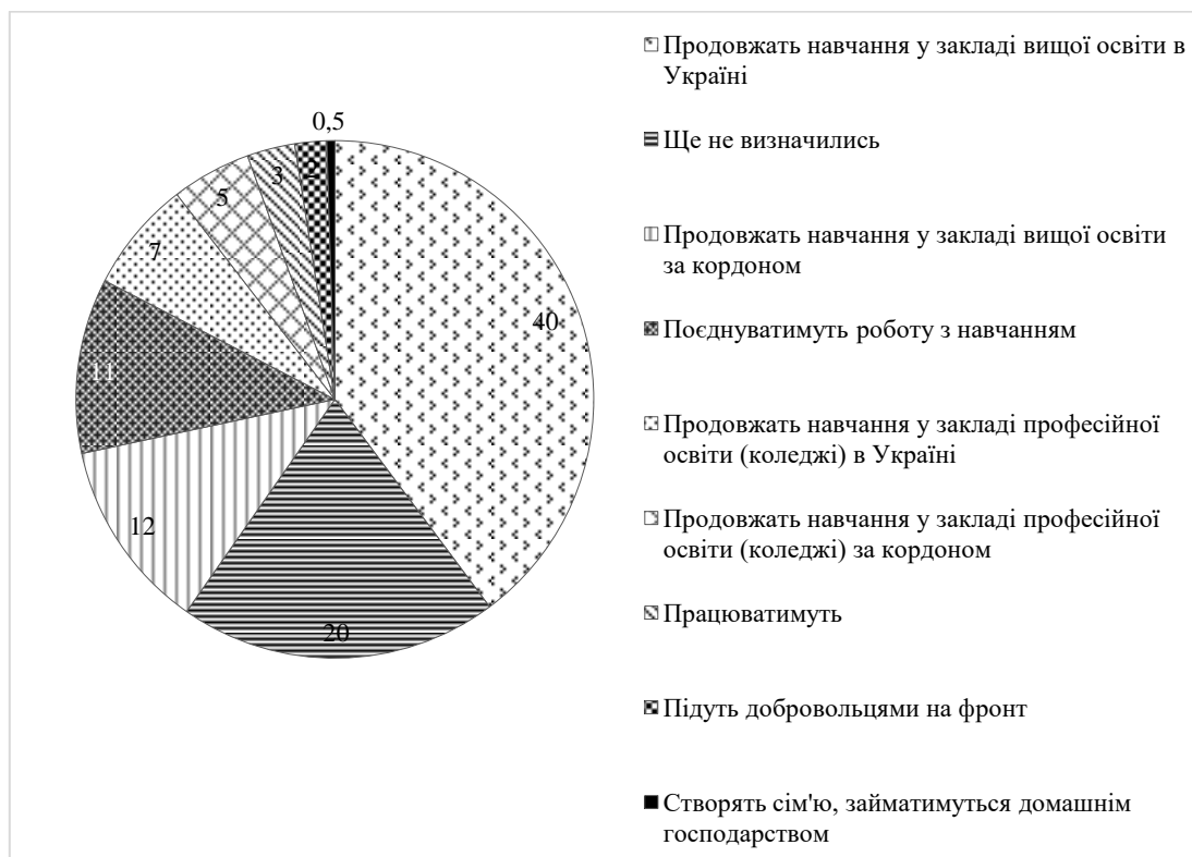
Рис. 1. Плани старшокласників після закінчення школи у 2024 р., %

– 11%; піти добровольцями на фронт – до 2%; створити сім'ю та займатися домашнім господарством – до 1%.