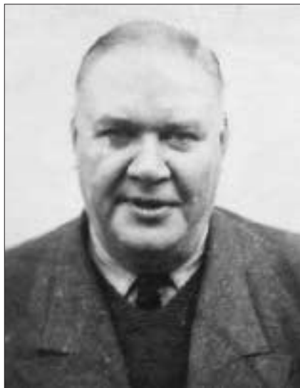
Гауптштурмфюрер СС Вільгельм Вірзінг. 1950 р.

24 січня 1951 р. в м. Нюрнберг-Фюрті у Західній Німеччині відбулося судове засідання у справі гауптштурмфюрера СС Вільгельма Вірзінга. Йому інкримінували участь у 15 допитах, на яких він сам або інші особи за його наказами застосували тортури. Жертвами цих тортур під час Другої світової війни були українські націоналісти.