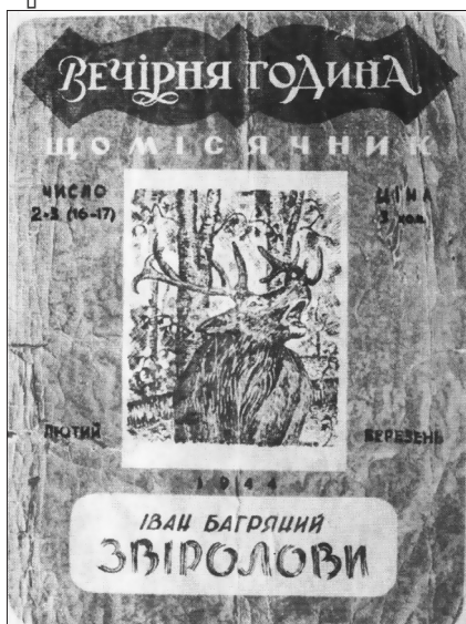
Обкладинка журналу «Вечірня година», в якому було надруковано первісний варіант повісті «Тигролови» під назвою «Звіролови»

грняний написав «Казку про Лелек і Павлика-мандрівника», а на світанку четвертого числа, «на шістнадцятий день мого ув'язнення», вирушив до Львова. У великому місті загубитися від переслідування було простіше, ніж у маленьку містечку, де всі одне одного знають 56 .