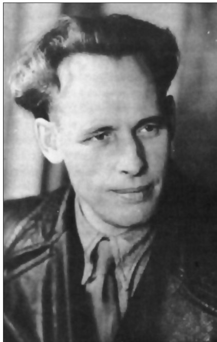
Іван Багрянний, кінець 1945 р.

Видатний український письменник Іван Багрянний уже в 30х рр. сформувався як противник радянської влади і заробив тавро «буржуазного націоналіста». Відбувши три роки заслання на Далекому Сході і провівши два роки під тортуррами у в'язниці НКВД, у 1941 р. він за переконаннями був готовий приєднатися до політичних сил, які виборювали б незалежну Україну. Тому природно, що під час Другої світової війни Багрянний співробітничав з Організацією Українських Націоналістів (як мельниківців, так і бандерівців) і Українською Повстанською Армією.