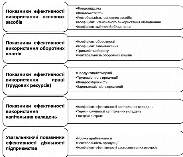
Рис. 1. Групи показників діяльності підприємства

Групи показників, що виділяють у системі показників ефективності господарської діяльності суб'єкта господарювання наведено на рис. 1.