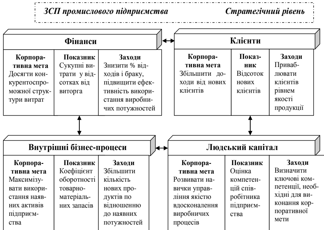
Рис. 1. Взаємозв'язок людського капіталу з іншими складовими ЗСП у рамках загальноприйнятої стратегії промислового підприємства [Авторська розробка]

Фінансова складова описує матеріальні результати реалізації стратегії за допомогою фінансових показників.