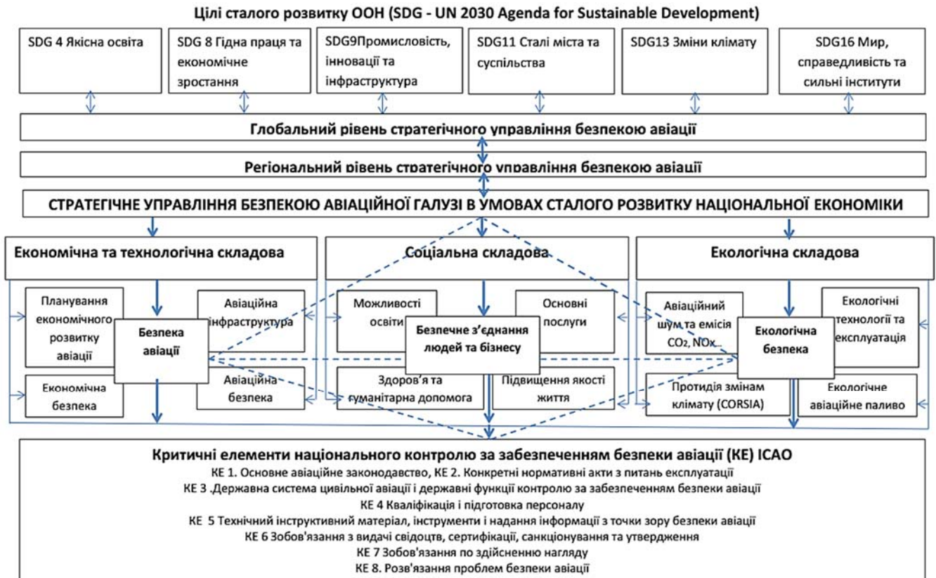
Рис. 1. Структурно-функціональна схема стратегічного управління безпекою авіаційної галузі в умовах сталого розвитку національної економіки

Виклад основного матеріалу дослідження. Пропонуєвану структурно-функціональну схему стратегічного управління безпекою авіаційної галузі в умовах сталого розвитку національної економіки наведено на рис. 1.