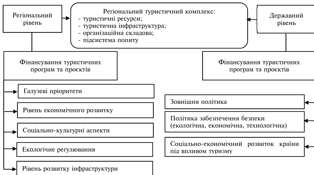
Рис. 2. Фактори, що впливають на фінансування туристичних програм та проєктів