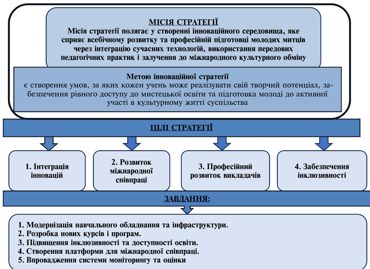
Рис. 2. Інноваційна стратегія для позашкільних мистецьких освітніх закладів

Отже, на основі вище визначеного, можна побудувати концептуальну схему інноваційної стратегії для позашкільних мистецьких освітніх закладів (рис. 2).