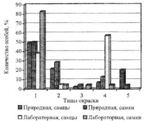
Рис. 2. Соотношение самцов и самок разного типа окраски в природной и лабораторной популяции.

Как мы уже говорили, наиболее распространенными являются особи, относящиеся к первому морфотипу, т. е. коричнево-серые бабочки. Бабочки этой окраски могут откладывать яйца в пограничных районах и незаметны как на коре ветвей, так и на коре ствола в его срединной части. Мы считаем, что эти особи имеют высокую жизнеспособность и приспособлены к неблагоприятным условиям. Как видно на рис. 1, соотношение морфотипов у особей, выращенных в лаборатории, изменяется в сторону увеличения первой и четвертой форм.