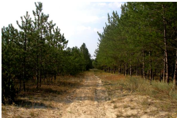
Рис. 2. Жебриянская гряда — биотоп I. filicata .

В Европе вид би- или тривольтинный (Hausmann, 2004). В Румынии (Racosy, Weiser, 2000) и Болгарии (Zlatkov, 2007) I. filicata летает в двух генерациях в году с начала мая до начала сентября. Даты находок наших экземпляров (10 мая и 03–14 августа) свидетельствуют о том, что в течение года этот вид в дельте Дуная также имеет две генерации. Имаго первого поколения летают в мае, второго — в августе.