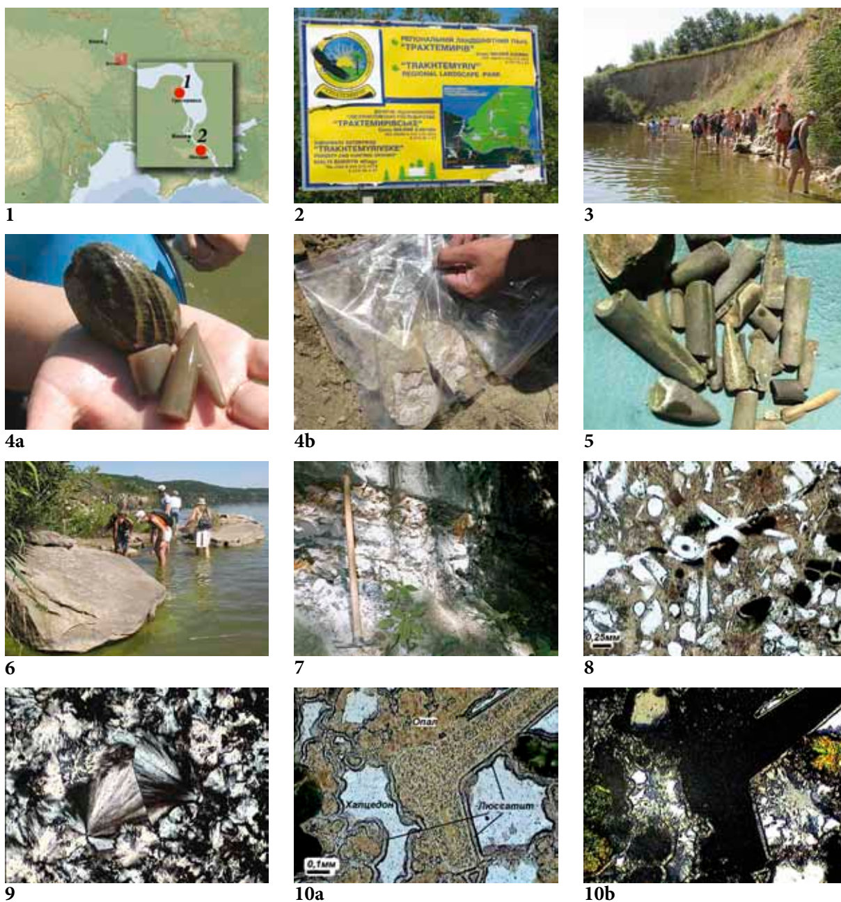
Рис. 1. Схема расположения геологических объектов: 1 — проявление складчатой тектоники с ископаемыми остатками юрской фауны; 2 — обнажения Холодного оврага. Рис. 2. Стенд на въезде на территорию регионального ландшафтного парка «Трахтемиров». Рис. 3. Берег Каневского водохранилища с обнажающимся ядром антиклинальной складки, сложенное юрскими глинами. Рис. 4. Образцы ископаемой фауны из юрских глин. Рис. 5. Многочисленные образцы ростров юрских белемнитов из пляжевых отложений. Рис. 6. Глибы кварцитовидного песчаника Трахтемировского горизонта бучакской свиты. Рис. 7. Обнажение глауконит-кварцевых песков буромской свиты с прослоями хоалцедонолитов в левом борту Холодного оврага. Рис. 8. Спонголит, содержит детрит спикул с разной степенью раскристаллизации биогенного опала. Рис. 9. Халцедонолит, образовавшийся на месте перекристаллизованных опаловых спикул. Рис. 10. Стадийная раскристаллизация биогенного опала от аморфного до кристаллического состояния (от опала через люссатит до халцедона): а — параллельные николи; б — скрещенные николи (фото в поляризационном микроскопе).