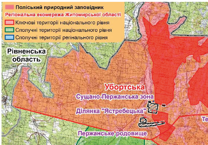
Рис. 2. Картохема розміщення природоохоронних територій і родовищ берилію (Пержанське родовище) та цирконію (ділянка «Ястребецька») (межі за вебсайтом: pryroda.in.ua).