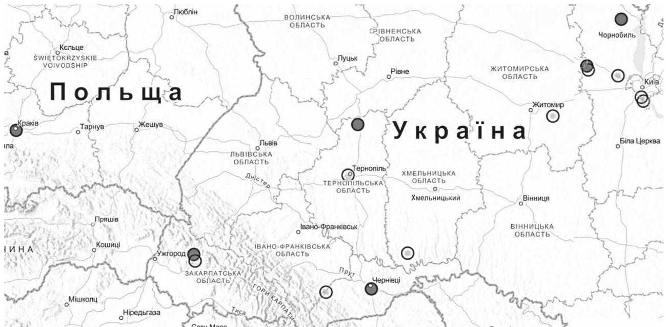
Рис. 3. Географічне розташування локалітетів, з яких були відібрані зразки рослин I. parviflora . Темно-сірі та світло-сірі позначки відповідають зразкам, які належать до генетичних кластерів 1 та 2, відповідно.

Широке географічне розповсюдження певних генотипів та, водночас, наявність різних генотипів на спільній території, є характерним для інвазійних видів, внаслідок їх розповсюдження в результаті діяльності людини (Smith et al., 2020; Tynkevich et al., 2025). Проте, можливо, залучення для аналізу більшої кількості зразків дозволить розпізнати патерни розповсюдження I. parviflora в Україні та на території сусідніх країн.