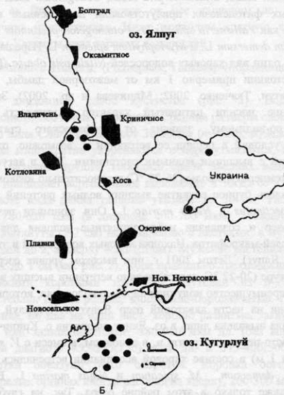
Рис. 1. Местонахождения (●) Chara uzbekistanica Hollerb. в Украине (А) и Придунайских озерах Ялпуг и Кугурлуй (Б).

с различной долей раковинного детрита. В районах положительных форм рельефа встречаются пески крупнозернистые, разнозернистые, карбонатные, сложенные раковинным детритом, изредка кварцевые (Сучков и др., 2002). Соленость данного водоема в 2000 г. составила 0,37-0,49 ‰, а в 2001 – 0,39-0,92 ‰, значение pH изменялось от 6,75 до 8,85 (Деньга, Мединец, 2002). Экологическая ситуация в исследуемых водоемах достаточно напряженная. Так, в 2001 г. из 18 измеряемых гидрохимических параметров регистрировалось их превышение по 7 в оз. Ялпуг и по 5 – в оз. Кугурлуй. Интегральным показателем трофического статуса водоемов рассматривают концентрацию хлорофилла “а” (Ковалева, Мединец, 2002). По этому параметру озера Кугурлуй и Ялпуг отнесены к мезотрофному типу, а северная половина последнего – к эвтрофному. Здесь наблюдается постоянный приток биогенов из внешних источников (сток р. Ялпуг и хозяйственно-бытовые стоки г. Болграда) (Сучков и др., 2002).