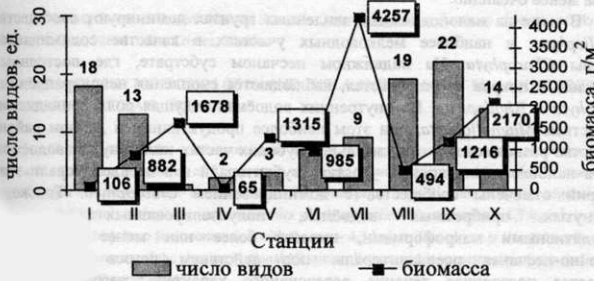
Рис. 3. Изменение числа видов и биомассы макрофитов в водоемах о. Тузла и прилегающей акватории Керченского пролива (ст. I-X).

В общем, в исследованном районе по количеству видов преобладают олигосапробы: их доля в большинстве случаев колеблется в пределах 40-50 %. Лишь в изолированном водоёме и в псевдолиторали водоёма, имеющего с морем ограниченную связь, 100 % приходится на долю мезосапробионтов. По биомассе почти во всех случаях (в основном за счёт цветковых растений) представители мезосапробной группировки доминируют (93-100 %). На морских мелководьях благодаря относительно обильному развитию Chondria tenuissima и Lamprothamnium papulosum доля олигосапробов составляет 30-76 %. Особо следует отметить ситуацию на ст. V, где вследствие массового развития Chaetomorpha crassa , относимой к олигосапробам (Калугина-Гутник, 1975), около 95 % биомассы приходится на долю данной группировки. По нашим наблюдениям, этот вид обычно присутствует и образует значительную биомассу в мелководных прибрежных акваториях, характеризующихся достаточно высоким уровнем естественного или антропогенного эвтрофирования. Очевидно, Chaetomorpha crassa правильнее относить к мезосапробной группе организмов, но в данной работе сапробиологический статус данного вида оставлен без изменений.