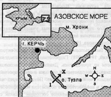
Рис. 1. Схематическая карта района исследований.

Сплошной ледовый покров устанавливается в умеренные и холодные зимы с конца декабря – начала января. Окончательно лёд исчезает к концу февраля. Основная роль в формировании течений принадлежит полю ветра, а также разности уровня моря на концах пролива, обусловленной сгонно-нагонными колебаниями и различиями в пресном балансе двух морей. В целом преобладает перенос вод из Азовского моря в Чёрное. Средняя скорость течения 10-17 см/с, в узкостях – до 30-40 см/с (максимум до 120-130 см/с).