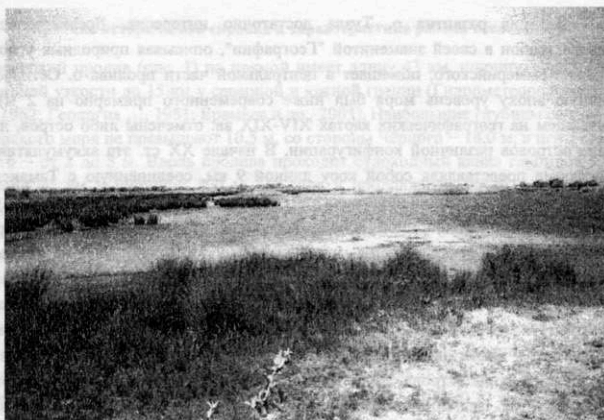
Фото. Типичный водно-болотный ландшафт острова Тузла.