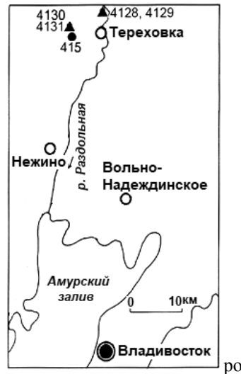
Рис. 1. Схема розташування досліджених розрізів пліоцену Примор'я

Перекриваються відклади базальтовим покривом потужністю 0,7 м та алевролітами потужністю 1,1 м. Базальти верхнього потоку мають зворотню залишкову намагніченість, яка відповідає палеомагнітній ортозоні Matuyama (Alekseev, 1978).