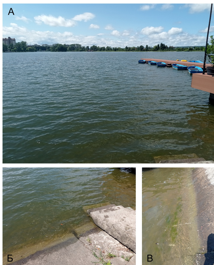
Рис. 1. Місце відбору проб — Міський став м. Івано-Франківська. A — загальний вид ставу; B — бетонні плити та бетонні сходи біля берега; C — водоростеві обростання на бетонній плиті

Водорість була знайдена в пробі перифітону, відібраній у Міському ставі м. Івано-Франківська в серпні 2023 р. Міський став (або Міське озеро, або Станіславське море) — найбільший штучний став Івано-Франківська, розташований у південно-західній частині міста (рис. 1). Площа його водного дзеркала складає 36 га, глибина — від 2,5 до 5,0 м. Споруджений у 1955 р. (City Lake..., 2020).