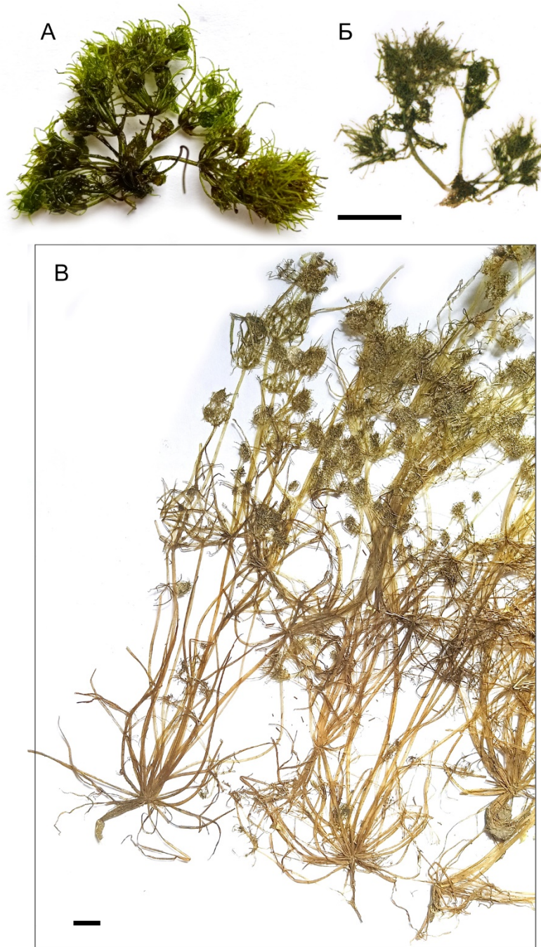
Рис. 2. Tolypella intricata (Trentepohl ex Roth) Leonhardi. Зовнішній вигляд гербарних зразків: A, B — з Харківської обл. (CWU № 203664); B — з Львівської обл. (KW). Масштаб лінійки 1 см