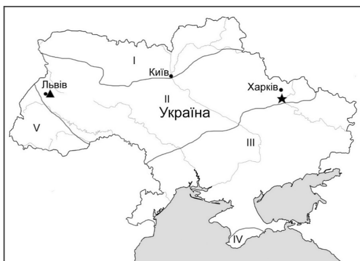
Рис. 4. Картошка місцезнаходжень Tolypella intricata (Trentepohl ex Roth) Leonhardi в Україні: ★ — нове місцезнаходження в Харківській обл. (2024 р.); ▲ — раніше відоме місцезнаходження у Львівській обл. (2010 р.). Римськими цифрами позначені альгофлористичні підпровінції: I — Прип'ятсько-Деснянська, II — Середньодніпровська, III — Дніпровсько-Причорноморська, IV — Гірськокримська та V — Карпатсько-Дунайська

Листкові кінці з 4–7 клітин; верхівкова клітина коротка, конічна. Стерильні листки у вузлах прості або розгалужені на три клітини – середню найдовшу та дві бокові короткі. Гаметангії об'єднані у вузлах розгалужених плодоносних листків. Оогонії широко еліпсоїдні, як правило, по 2–4, сидячі, 280–290 мкм завд., 240–250 мкм завш., іноді поодинокі, стебельчасті. Коронка оогоніїв не опадаюча, 29–32 мкм завш., з клітинами більш-менш однаковими за розмірами. Антеридії у вузлах та при основі листків, 250–275 мкм, сидячі або стебельчасті, на ніжках до 610 мкм завд. Ооспори темно-коричневі, 400–450 мкм завд., 335–344 мкм завш. Таким чином, незважаючи на невеликі розміри зібраних зразків виду, розміри їх репродуктивних органів дещо менші, проте близькі до вказаних у визначниках та монографіях (Hollerbach, Palamar-Mordvintseva, 1991; Krause, 1997; Langangen, 2007; Urbaniak, Gąbka, 2014).