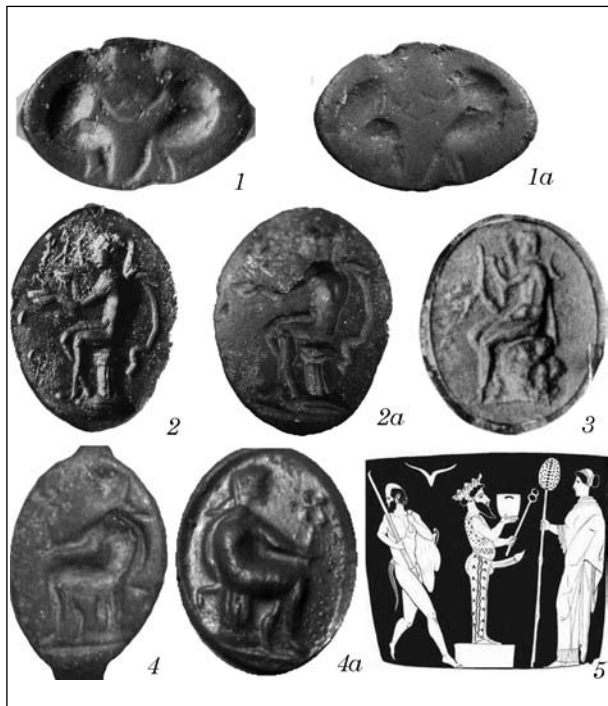
Рис. 1. Щитки бронзовых перстней (1—4): 1, 2 — Бельское городище [Шрамко, 1987, рис. 74]; 3 — Ольвия [Античная ..., 1973, кат. 113]; 4 — Крым (фото щитка, а — оттиск) [http://perstni.com]; 5 — изображение Гермеса с кадуцеем и сосудом на кратере из Сиракуз [Ходза, 2008, ил. 4]

Строгая периодичность праздника усиливала его значения в жизни местного населения, так как он мог служить основой для календарных расчетов. В таком важном празднестве должен был принимать участие и гелонский царь, возможно, в качестве верховного жреца-эпонима. В таком случае надпись на перстне могла передавать его имя. Известно, что Дионис нередко изображался с головой быка или бычьими рогами, что соответствует рисунку на втором перстне» [Шрамко, 1987, с. 161, 162; рис. 74].