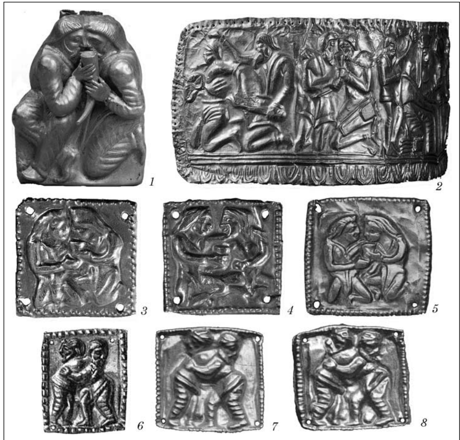
Рис. 2. Золотые украшения с изображением сцен побратимства (1—5) и борьбы (6—8): 1 — Куль-Оба [Scythian ..., 1986, pl. 196]; 2 — Сахновка [Золото ..., 1991, кат. 99]; 3, 4 — Бердянский курган [Золото ..., 1991, кат. 100g]; 5 — Солоха [Алексеев, 2012, с. 161]; 6 — Чмырева Могила [Браун, 1906, рис. 37]; 7, 8 — курган № 8 группы «Пять братьев» Елизаветовского курганного могильника [L'Or ..., 2001, cat. 85]

очень отчетливое впечатление обнаженности мужчин 2 (рис. 1, 1, 1а).