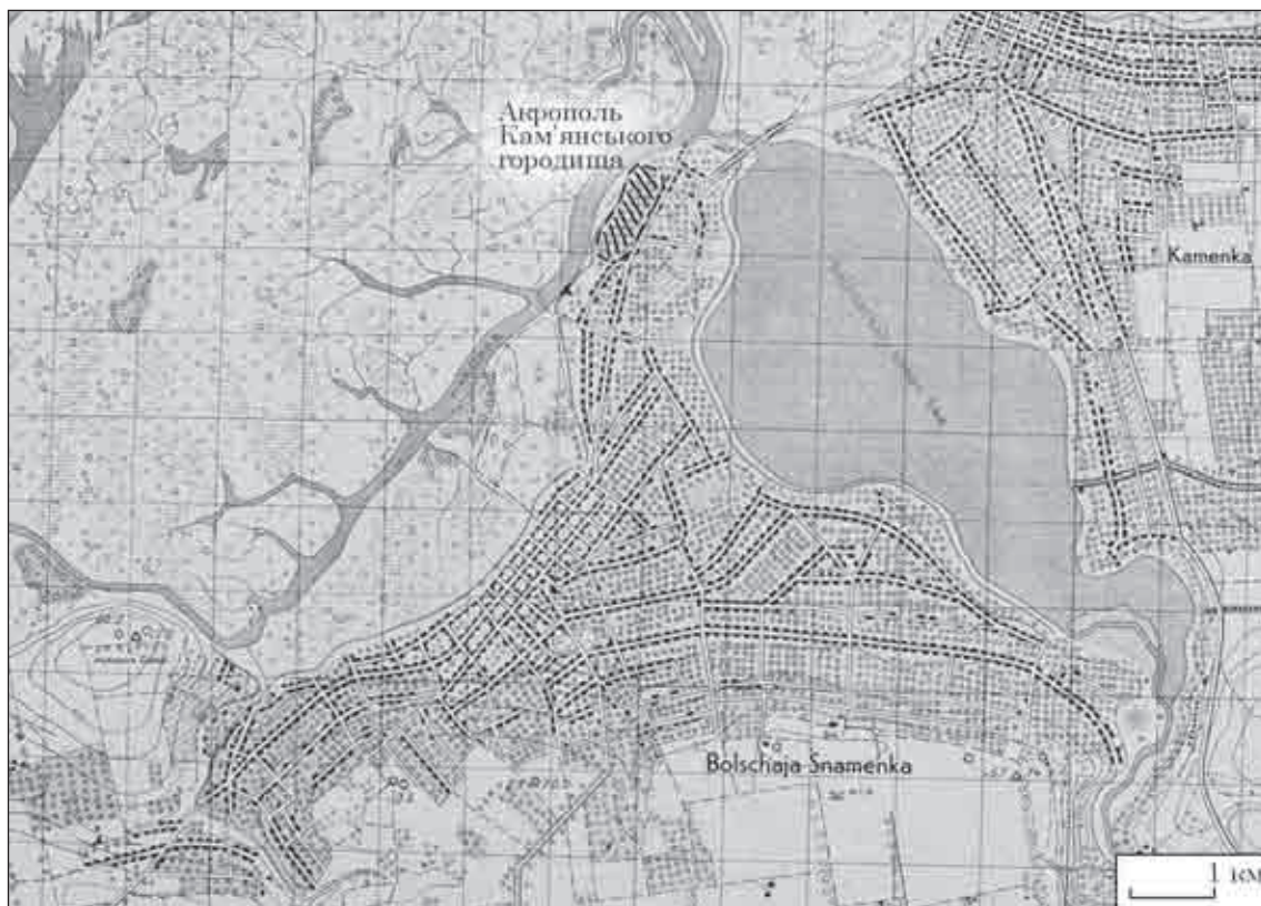
Рис. 2. Фрагмент листа німецької військової карти з позначеним шляхом через заплаву Дніпра й Конки: переправа починається від південного краю «Акрополя» Кам'янського городища

царя до трансскіфської магістралі 1 [Болтрик, 1990, с. 39—41]. Але залишався сумнів: навіщо було зводити один з найбільших курганів Скіфії в такому малозначущому місці — перетин хай важливим шляхом пересихаючої Сірогозької балки не є настільки привабливим. Але виявилось, що місце було знаковим. І це з'ясувалось завдяки листу карти трьохверстки (XXIX—13) (Велика Білозерка), розміщеному в Інтернеті. Повз курган Огуз з Перекопу в напрямку м. Оріхова Запорізької області проходив Муравський шлях 2 (його ще називають