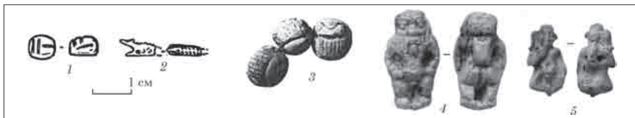
Рис. 1. Фаянс из погребений Красного Маяка, могилы: 1 — № 6; 2 — № 10; 3 — № 35, погребение 2; 4, 5 — погребение 126, скелет 3

(рис. 1, 1) [Сымонович, 1976, с. 14]. В могиле 10 найдена фигурка крокодила из египетского фаянса с отбитым хвостиком (рис. 1, 2) [Сымонович, 1976, с. 17]. В погребении найдено две фибулы: сильнопрофилированная с бусинами на дужке с нижней тетивой II серии, II — первой половины III вв. н. э., повсеместное господство во II в. [Кропотов, 2010, с. 230] и фибула-брошь с шарниром из двух стоек формы 8, датирующаяся в пределах второй-третьей четверти I в. н. э. [Кропотов, 2010, с. 305]. Фаянсовые пронизи в виде крокодила типа Алексева 72 датированы в своде второй половиной I в. до н. э. — I в. н. э. [Алексеева, 1975, с. 45]. Вероятное время создания комплекса — третья четверть I — II в. н. э.