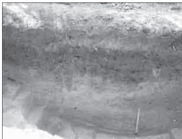
Рис. 4. Фото заповнення оборонного рову на майданчику городища

Оборонний вал городища розташований в його східній та північно-східній частині. Він на сьогоднішній день представлений трьома окремими частинами: північною, центральною та південною. Північна частина має максимальну висоту в східній частині — 2 м і в західній частині сходить нанівець. Довжина відрізка близько 20 м. Ширина становить 6—8 м. В центрі відрізка валу добре