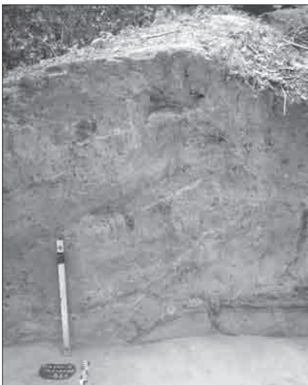
Рис. 3. Фото оборонного рову, перекритого валом Малинського городища

до думки про формування городища та його оборонних споруд в пізньосередньовічний період.