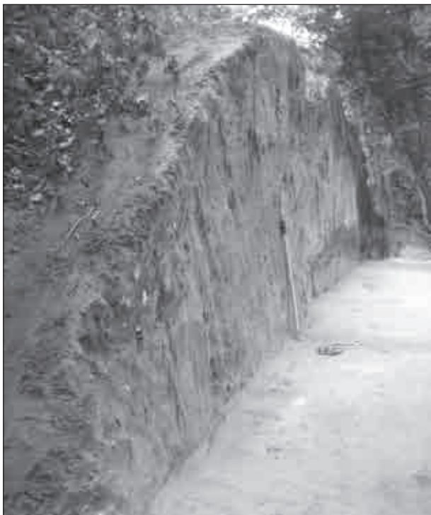
Рис. 2. Фото розрізу валу оборонного рову