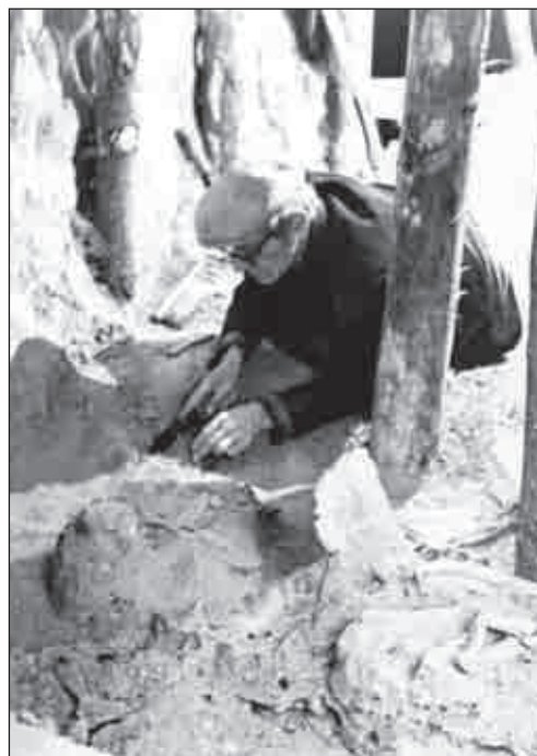
На раскопках Гаймановой Могилы, 1969 г. Северная гробница № 1

ования глубоких подземных погребальных сооружений с использованием специальных материалов для их крепления и привлечением квалифицированных специалистов.