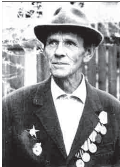
С фронтовыми наградами. Начало 1970-х гг.