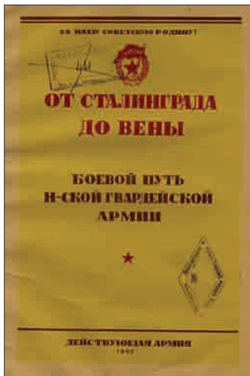
Титульный лист книги «От Сталинграда до Вены»

По прошествии десятилетия М.Е. Массон 2 , оспаривал вывод, что в кушанское время Афрасиаб находился в состоянии упадка. А.И. Тереножкин же и в дальнейшем продолжал на-