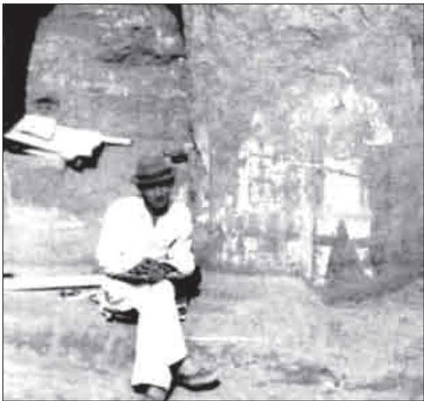
На раскопках Пянджикента. Храм № 2 с настенными росписями. Август 1948 г.