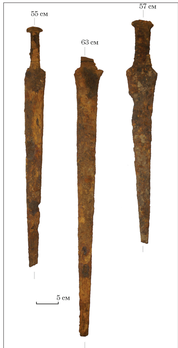
Рис. 4. Мечи синодо-меотского типа из коллекции Государственного Эрмитажа