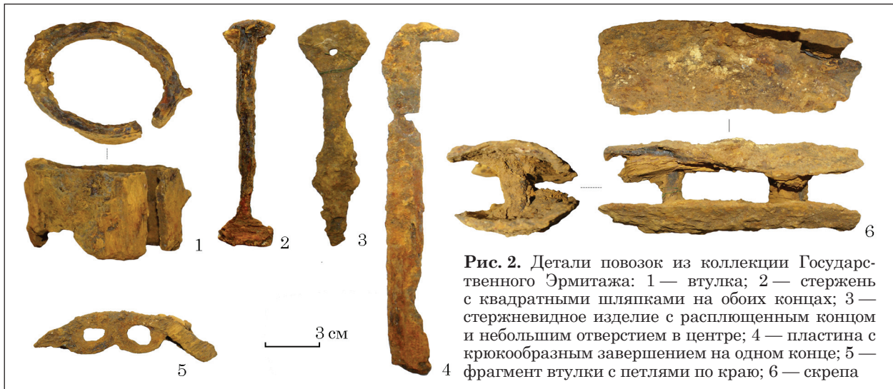
Рис. 2. Детали повозок из коллекции Государственного Эрмитажа: 1 — втулка; 2 — стержень с квадратными шляпками на обоих концах; 3 — стержневидное изделие с расплюснутым концом и небольшим отверстием в центре; 4 — пластина с крюкообразным завершением на одном конце; 5 — фрагмент втулки с петлями по краю; 6 — скрепа