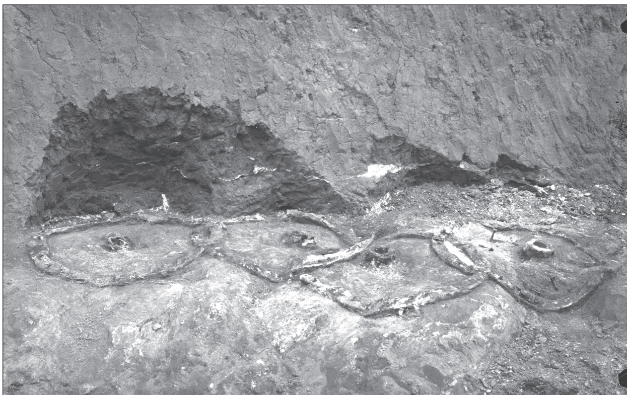
Рис. 5. Фотография из архива ИИМК РАН, на которой запечатлены колеса из Елизаветинского кургана 1915 г. (раскопки Н. И. Веселовского)

шест — очевидно, дышло, обитое на конце листовым железом» (ОАК за 1913—1915, с. 153). Два других колеса повозки были разломаны грабителями и брошены ими в яме, вырытой при ограблении памятника.