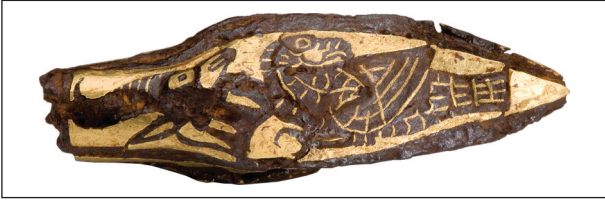
Рис. 4. Железный наконечник стрелы с золотой аппликацией.

Величина его трехгранной в сечении головки почти вдвое превышает размеры других наконечников в колчане. Абрис граней — листовидный. На каждой грани этой стрелы — аппликация из золота, изображающая фигуру хищной птицы с повернутой назад головой и голову антилопы перед ней. Образы переданы тонкой ажурной резьбой по золотому листу путем удаления частей фона. Такое изделие, несомненно, должно было выполнять особую ритуальную функцию, возможно, связанную с «расширением земли».