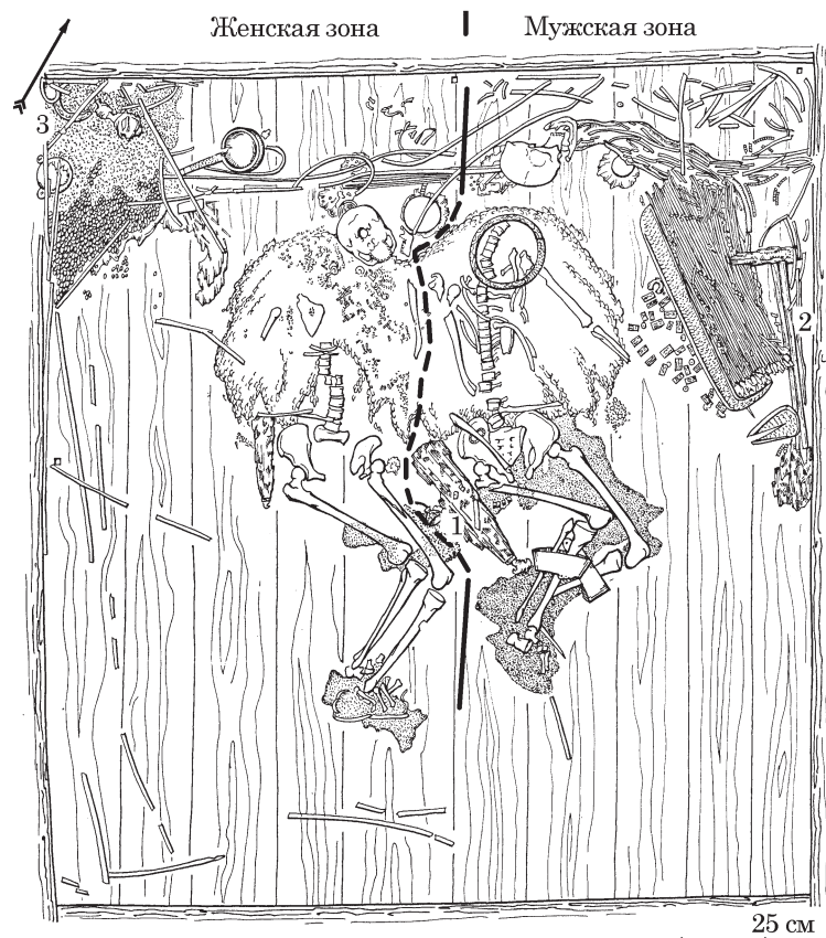
Рис. 1. План основного погребения в кургане Аржан-2 с обозначением мужской и женской зон. Цифры на плане: 1 — подвеска в виде котла; 2 — местонахождение декора плети; 3 — каменные жертвенники, остатки плодов и зёрен растений

Гораздо важнее для раскрытия обозначенной темы, что в размещении различных предметов в царской могиле Аржана-2 можно выделить две зоны — мужскую и женскую, и соотнести с захороненной парой (рис. 1). Подобное расположение атрибутов, с учетом местных особенностей погребального обряда, было показано