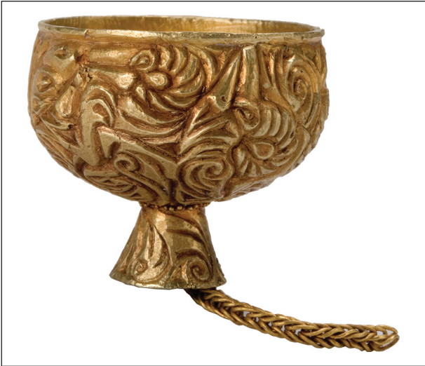
Рис. 2. Золотая подвеска в виде котла.

Д. А. Мачинским в комплексе Толстой Моги- лы, где на основании анализа греко-скифского искусства и античных текстов реконструируется символическое присутствие пары божеств — Ареса и Аргимпасы, где первый обозначался мечом в золотых ножнах, а вторая пекторалью (Мачинский 1978, с. 147). Соответственно, божественная сущность погребенных должна быть отражена в неких специальных, только им присущих атрибутах или их сочетаниях.