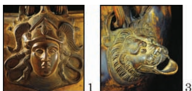
Рис. 5. Наиболее поздние бронзовые сосуды из Печаного. Киев, НМИУ: 1—3 — стамноидная ситула, инв. № Б41-437; 4 — кратер, инв. № Б41-441

она могла быть во вторичном использовании. В. Фукс датировал пластину по стилистическим признакам серединой V в. до н. э. (Fuchs 1978, S. 114), оставив без внимания наиболее близкие параллели изображению на ней: 1) на нащечнике, вероятно, элементе бронзовой скульптуры из Дельф (Rolley 2001, p. 94, fig. 1; 2002, p. 41—44, no. 1, figs. 1—2), и 2) на пластине вторичного использования, припаянной под нижним атташем вертикальной ручки более позднего (I в. до н. э.?) бронзового кувшина с серебряной инкрустацией из Босний в Сербии (Picard 1962—1963, p. 1—7; Rolley 2002, p. 44, note 18; Ratkovic 2005, p. 82—85, no. 27 с литературой). Впрочем, и с точки зрения иконографии сопоставление изображения с эмблемами на серебряных статерах Элиды около 471 г. до н. э. (Крау 1976, p. 91, 104, pl. 18, no. 323), а