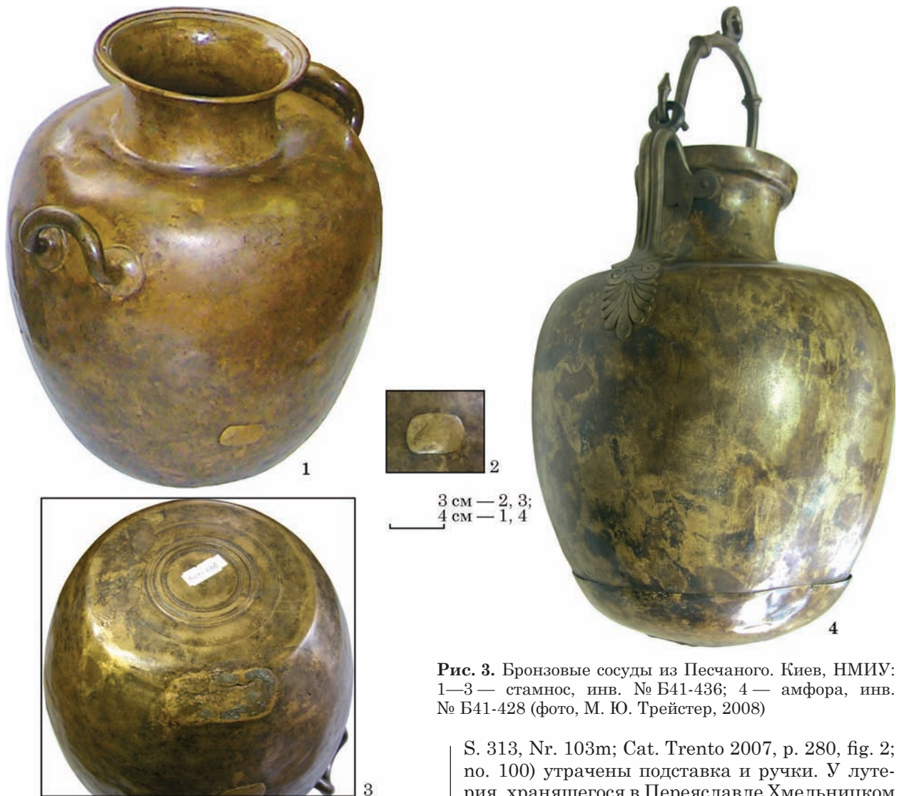
Рис. 3. Бронзовые сосуды из Песчаного. Киев, НМИУ: 1—3 — стамнос, инв. № Б41-436; 4 — амфора, инв. № Б41-428 (фото, М. Ю. Трейстер, 2008)

390) аккуратно наложенными в местах трещин и литейного брака, есть основания полагать, что они могут иметь отношение к ремонту сосуда, выполненному мастером сразу же после изготовления, тем более что и по цвету металл латок соответствует металлу сосуда.