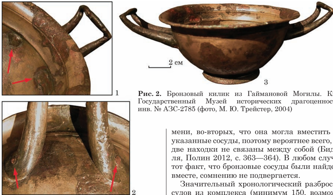
Рис. 2. Бронзовый килик из Гаймановой Могили. Киев, Государственный Музей исторических драгоценностей, инв. № АЗС-2785

Ignatiadou 2015, p. 81—82, fig. 10) и Кум в Южной Италии (Gabrici 1913, p. 559—561, fig. 208). Кроме того, и бронзовая фляга (Leskov 1990, 192, Nr. 233; Abb. 67; Leskov и др., 2013, с. 31, № 2, с. 122, рис. 22: 1), найденная в рассматриваемом ритуальном комплексе, вряд ли более поздняя, чем таз, а не исключено, что и более ранняя. Этот уникальный для Северного Причерноморья сосуд находит параллели среди находок из погребений периодов Гальштатт D3 и раннего Латена А в Италии и Центральной Европе 1 .