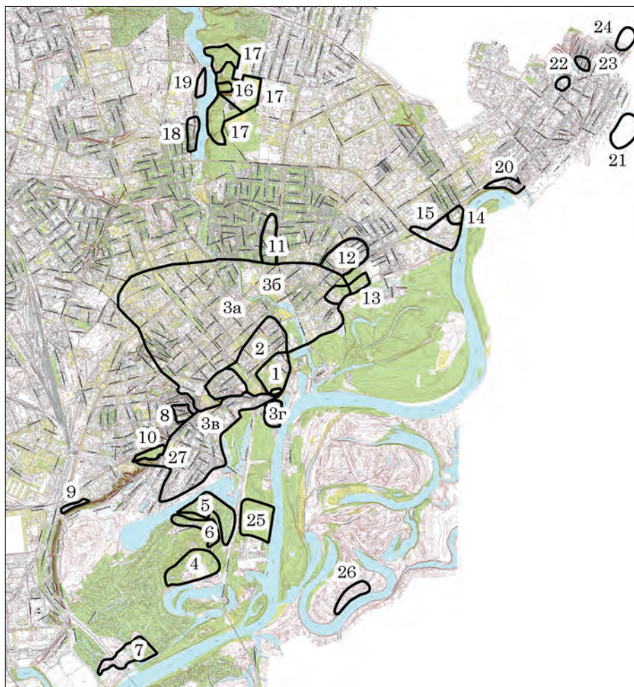
Рис. 3. Территория древнерусского Чернигова и поселения расположенные рядом с городом: 1 — Детинец Чернигова; 2 — Окольный град; 3 — открытые посады (а — на правом берегу р. Стрижень; б — на левом берегу р. Стрижень до появления укреплений Предградья; в — участок Подола на юг от Третьяка под краем террасы р. Десна; г — участок Подола в районе Речного вокзала); 4 — участок Подола (пос. Святое); 5 — участок Подола (пос. Церковище); 6 — участок Подола (пос. Пролетарский Гай—2); 7 — пос. Микулино; 8 — загородный княжий двор в районе храма на ул. Северянской; 9 — пос. Нефтебаза; 10 — курганы на Болдиных горах; 11 — курганы на «Кладбище в Березках»; 12 — курганы на ул. Шевченко; 13 — пос. Горсад; 14 — гор. Гюричев; 15 — открытый посад Гюричева; 16 — гор. Яловщина; 17 — посады гор. Яловщина; 18 — пос. Стрижень 2; 19 — пос. Стрижень 1; 20 — пос. Бобровица 1; 21 — пос. Юрков хутор; 22 — пос. Кленовое; 23 — пос. Кукашаны; 24 — пос. Яцева гора; 25 — участок Подола (пос. Кораблище); 26 — пос. Глушец; 27 — монастырь в Ильинском овраге

нистрации города и княжества. На участках, приближенных к западной, северной и восточной границам Предградья, на 1239 г. так и не успела появиться регулярная застройка. Возникает вопрос, для чего были построены укрепления такого размера? Каким образом должна была осуществляться их оборона? Для кого или для чего в пределах города существовали свободные участки? На один из ответов указывают описанные выше материалы разведок в пойме р. Десны. Не все горожане проживали в пределах укреплений. В случае военной угрозы население покидало свои строения и с движимым скарбом укрывалось за крепостными стенами.