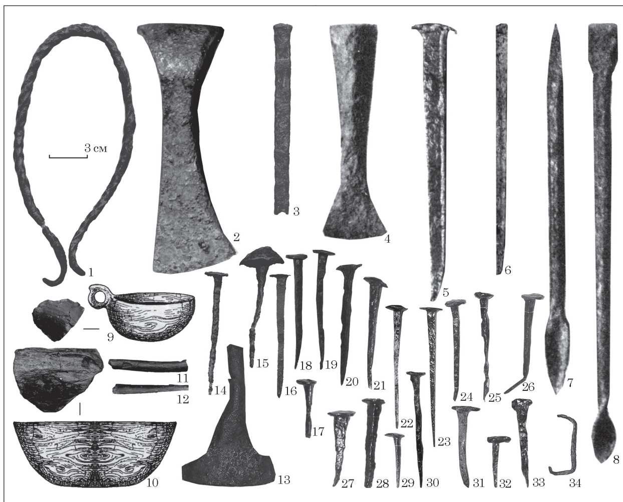
Рис. 2. Знаряддя та предмети, пов'язані з деревообробним ремеслом: 1 — дужка до відра; 2 — сокира, 3, 5 — долото; 4, 13 — тесло; 6 — кріпильний стержень; 7—8 — свердло; 9—10 — дерев'яний посуд; 11, 12 — дерев'яні кілки; 14—33 — цвяхи; 34 — скоба (1—3, 6—12, 14—16, 34 — Чорнівка; 5, 21—27 — Ленківці на Пруті; 4 — Недобоївці; 13, 28—33 — Зелена Липа; 17—20 — Василів)

тощо (Козловський 1990, с. 38; Шекун, Веремейчик 1999, рис. 65: 31; Прищеп 2016, с. 96).