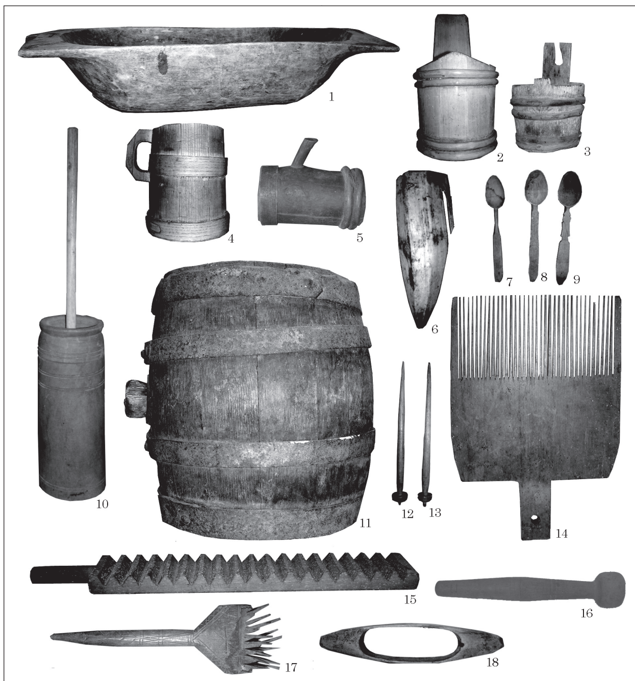
Рис. 1. Дерев'яні вироби XIX — першої половини XX ст. з теренів Північної Буковини

ду, що виявлені на городищах Чорнівка, Недобойці, містах Ленківцях на Пруті, Василеві (Возний 2009, с. 213).