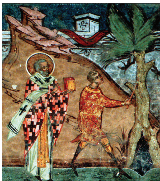
Рис. 4. Робота сокирою, зображення в церкві св. Іоана Ботезата в монастирі XV—XVI ст. у Гуморулуї (Південна Буковина, Румунія) (за: Solcanu 2002)

У давньоруські часи досить поширеним був дерев'яний посуд, що забезпечувалося наяв-