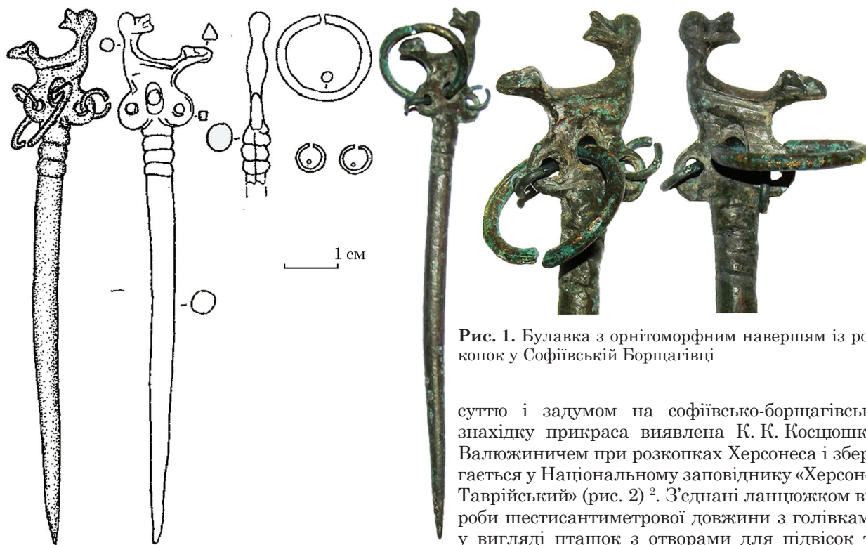
Рис. 1. Булавка з орнітоморфним навершям із розкопок у Софіївській Борщагівці

жалось обмеженим дном шляху (Рыбаков 1984, с. 317). Останній із перерахованих речей і присвячена пропонується публікація 1 .