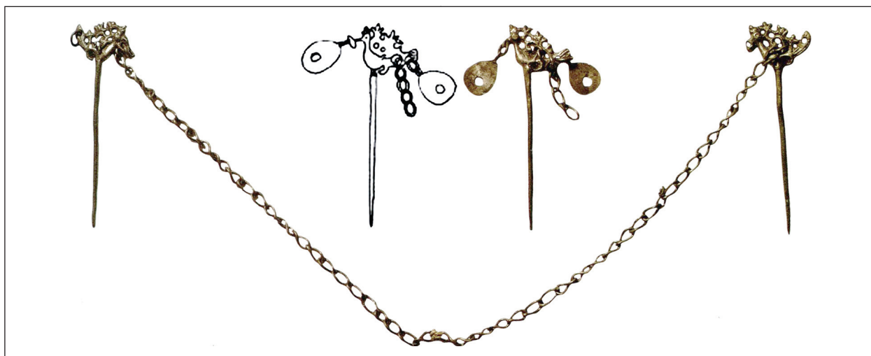
Рис. 2. Виявлені в Херсонесі булавки з орнітоморфним навершям за Т. Ю. Яшаєвою та ін. (фото) і Л. Г. Колесніковою (прорисовка)