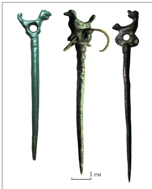
Рис. 5. Булавки із зооморфними навершнями з інтернет-ресурсів, пов'язаних із обігом рухомих археологічних пам'яток (права знахідка у джерелі запозичення не масштабована)

Слід зауважити, що долучення даних зі згаданих сайтів дійсно суттєво впливає на оцінку ролі й місця софіївсько-борщагівської знахідки.