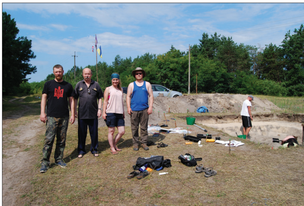
Разом з чернігівськими та англійськими науковцями. Виповзів, 2019 р.

Апофеозом, певним чином науковим передбаченням та окресленням найближчих наукових завдань давньоруської та середньовічної археології цього часу постала фундаментальна монографія Олександра Петровича, що побачила світ у 2009 р. — «Русь», «Мала Русь», «Україна» в після монгольські та козацькі часи». У ній він звернувся до розкриття складних, «недостатньо розроблених питань місця і ролі українського етносу» «у контексті тогочасної