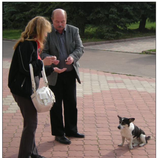
Переяслав, 2004 р.

суворими викликами: з'явилися наполегливі спроби нав'язати нам іншу історію, висвітлення найкарколомніших подій, як у внутрішньому просторі держави, ліворуч та праворуч. Та найбільша загроза постала з боку іншої держави. Це й інший погляд на формування та розвиток Київської Русі, і навіть риторичне питання, а була вона насправді та Київська Русь, і знак запитання щодо утворення та існування української державності, штучних концепцій щодо існування так званої Новоросії, цивіліза-