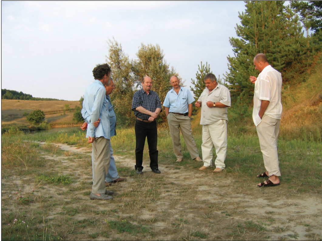
Робочий виїзд. Заповідник Чигирин

набуло й такої гостроти у практиці української державності, її незалежності та існування як країни в цілому. Здається, ніби то книга була передбаченням подій майбутнього, що сталося так незабаром. Справа у тому, що Олександр Петрович звертає увагу на «ті наукові розробки, в котрих «русько-українська тяглість» вималюється найбільш рельєфно» (Моця 2009, с. 7). У першу чергу — до «Історії України-Русі» М. С. Грушевського, про те, що довелося пережити українському народові: «Його старе, історичне ім'я Русь, Русин, руський, в часи політичного і культурного упадку було привласнено великоросійським народом» (Грушевський 1992, с. 1). За послідовним оглядом розвитку історіографії наступного століття, він перекидає місток до незаперечного висновку наприкінці ХХ ст., який висловив П. П. Толочко: «Родова назва «Русь» присутня в усьому: в означенні землі, країни, держави, народу, мови і навіть віри. Це незаперечний доказ безперервності історичного розвитку населення Південної Русі від слов'яно-руських часів до періоду пізнього середньовіччя» (Толочко 1993, с. 13).