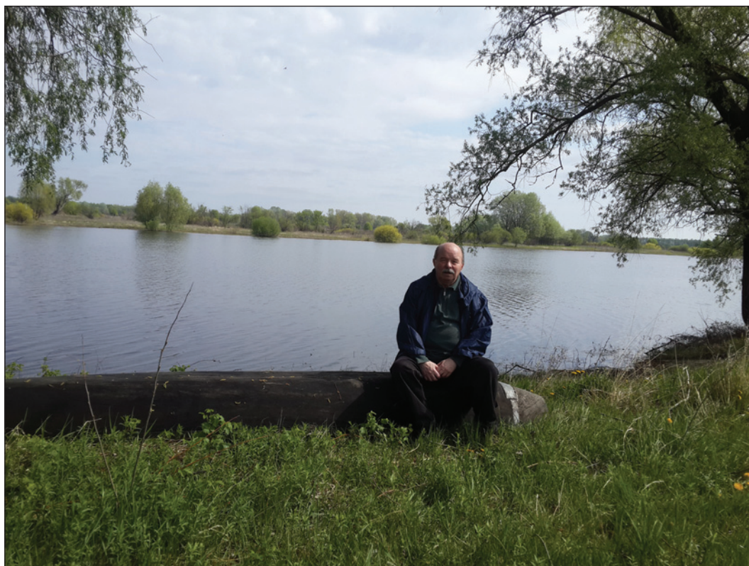
Морівськ, 2017 р.

торської місії Росії на території України, й відповідно необхідності захисту так званого «руського світу» у сучасних умовах.