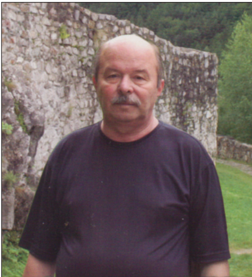
Словаччина, біля замку Стречно

Розвиток археологічної науки останніх десятиліть засвідчив визрівання нових тенденцій та напрямків досліджень сучасного рівня пізнання. Потреба нового бачення та нових підходів вивчення історії країни, застосування фактів археології у її побудові постали характерними рисами цивілізаційного процесу України. Особливо сильними виклики сучасності обернулися до визначних періодів існування українського народу, а саме від доби формування держави — Давньої Русі до сьогодення. Це вимагало нових підходів до багатьох концептуальних питань, що виходили з фактів археології. Лише вони могли бути основою пізнання, на відміну від застарілих схем, які передбача-