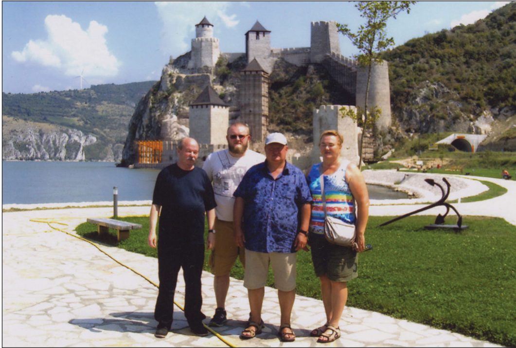
Белград, 2018 р.

на основа ранньоукраїнської цивілізації: археологічна карта другої половини XIII — початку XVIII ст.» (2017—2021).