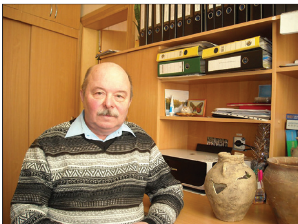
Чернігів, 2008 р.

Шлях від старого радянського минулого у світ європейства, інших цивілізаційних вимірів вимагав постановки нових інноваційних проблем, потужних міжнародних проєктів. Така ситуація потребувала не лише відповіді на болючі питання, але й стимулювала рух до наукової інтеграції у європейську та світову науку. Не випадково, наступну узагальнюючу працю «Анти» — «Руси» — «Українці». Формування ідентичності у слов'ян півдня Східної Європи V—XIX ст.», яка вийшла у