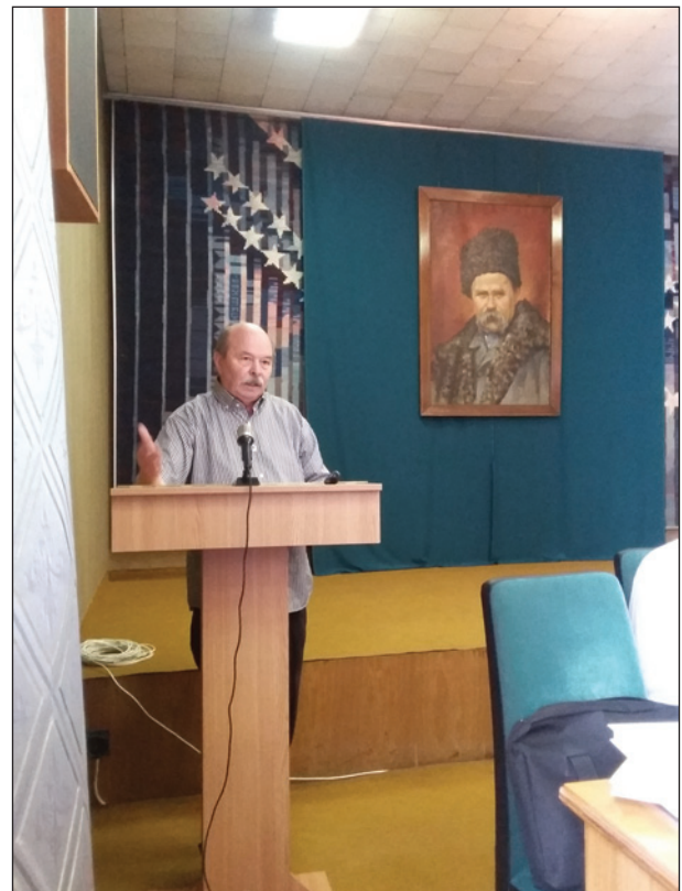
Національна бібліотека України імені В. Вернадського. Виступ на конференції

шому випуску нового видання «Археологія і давня історія України» під назвою «Проблеми давньоруської та середньовічної археології», спеціально присвяченому до 60-ліття видатного вченого.