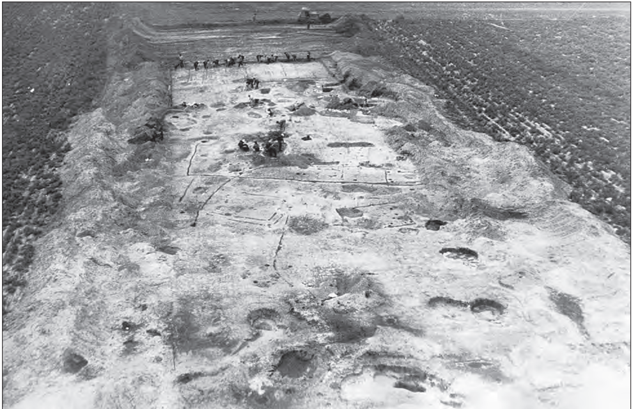
Дослідження поселення Автуничі, 1990 р.

Наприкінці 1980-х рр. Інститут археології АН УРСР розпочав програму широкого вивчення південноруського села X—XIII ст. Для отримання максимального обсягу інформації було обрано пам'ятку, що складалася з поселення й могильника — комплекс біля с. Автуничі Городнянського району Чернігівської області. Одним із завдань Поліського загону Дніпровської Давньоруської археологічної експедиції ІА АН УРСР, який очолив з 1987 р. вже завідувач сектору давньоруської та середньовічної археології ІА АН УРСР О. П. Моця, стало відтворення аграрного потенціалу в даному регіоні. Для цього обов'язково потрібно було мати приблизну уяву про залюднення селища та можливу кількість мешканців, що співіснували одночасно. Потрібну інформацію міг лише надати могильник, розташований в урочищі Космовка поблизу с. Автуничі.