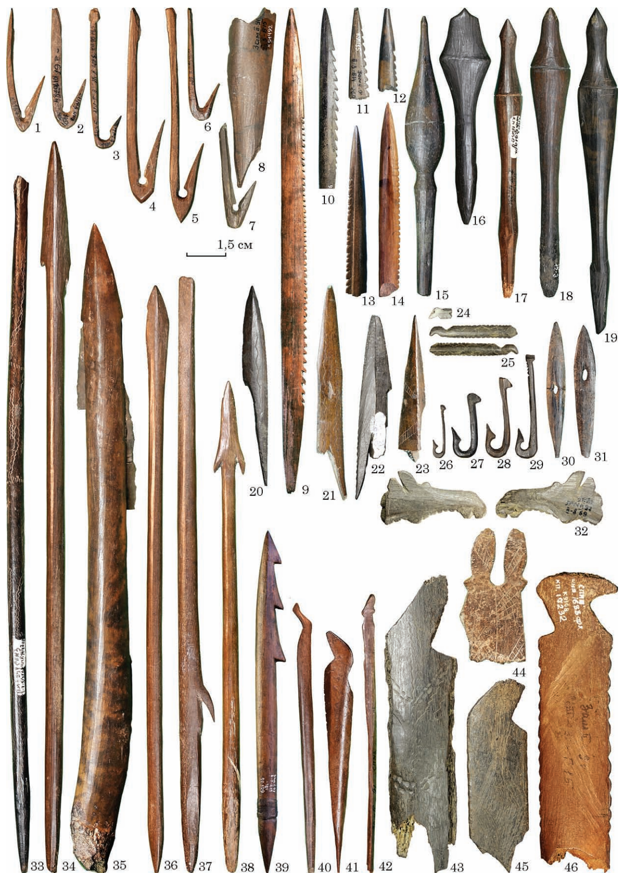
Рис. 3. Замостя 2, вироби з кістки і рогу лося: 1—7, 26—31 — рибальські гачки; 8 — кістка зі слідами від вирізання гачка; 9—14, 39 — зубчасті вістря; 15—19, 33, 34, 36—38 — наконечники стріл; 20—23 — пазові наконечники; 24, 25, 40—42 — шпильки з зооморфним наверхшям; 32 — головка лося; 35 — наконечник дротика із вкладишами; 43—46 — ножі з ребер лося з фігурним наверхшям (1—19 — ранній неоліт, 20—46 — пізній мезоліт)