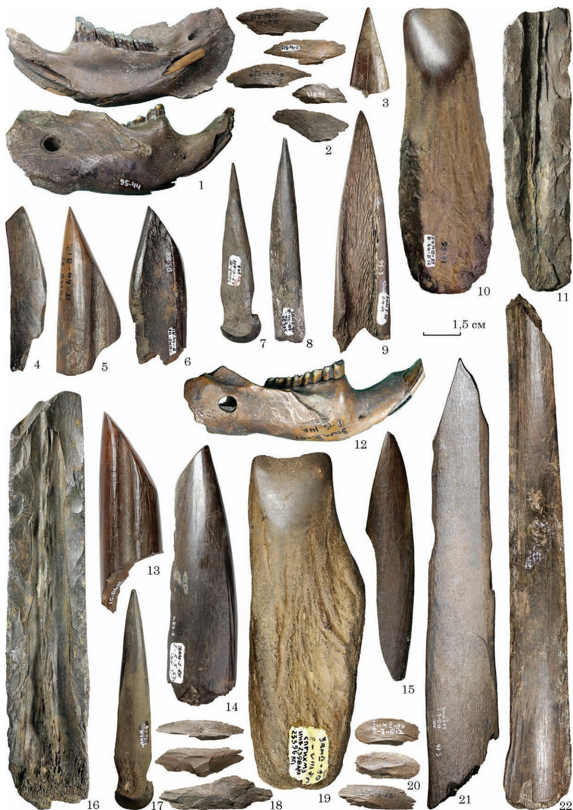
Рис. 2. Замостя 2, вироби з кістки і рогу лося: 1, 12 — знаряддя зі щелепи бобра; 2, 18, 20 — кістяні відщепи від оббивання трубчастих кісток; 3, 9, 15, 21, 22 — ножі з ребер лося; 4—6, 13, 14 — знаряддя, скошені під кутом 45°; 7, 8, 17 — проколки з грифельних кісток; 10, 19 — сокири / тесла з рогу лося; 11, 16 — заготовки із оббитих трубчастих кісток (1—11 — ранній неоліт, 12—22 — пізній мезоліт)