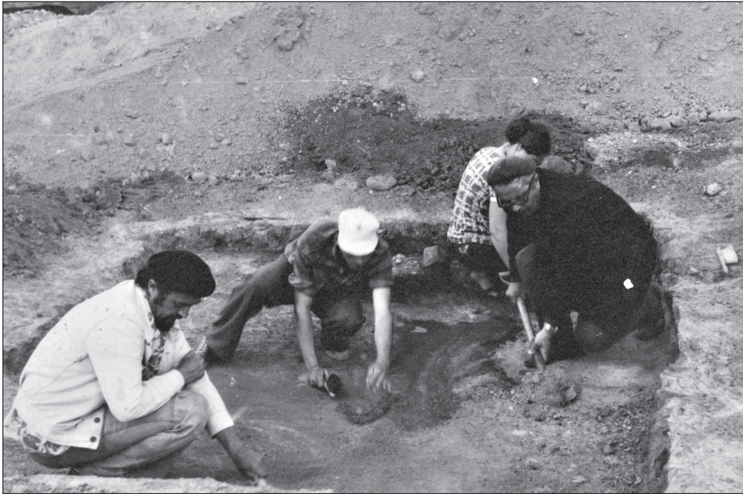
Розчистка землянки козацького дозору на кургані поблизу с. Чкалове, Запоріжжя, 1978 р.

Дніпро) і на Ігреньському півострові, де у 1660 р. славний козацький отаман Іван Сірко розгромив великий загін татар, звільнивши багато бранців. Кінематографісти разом з Д. Я. Телегіним також відвідали острів Хортицю (Там само, арк. 17—18а).