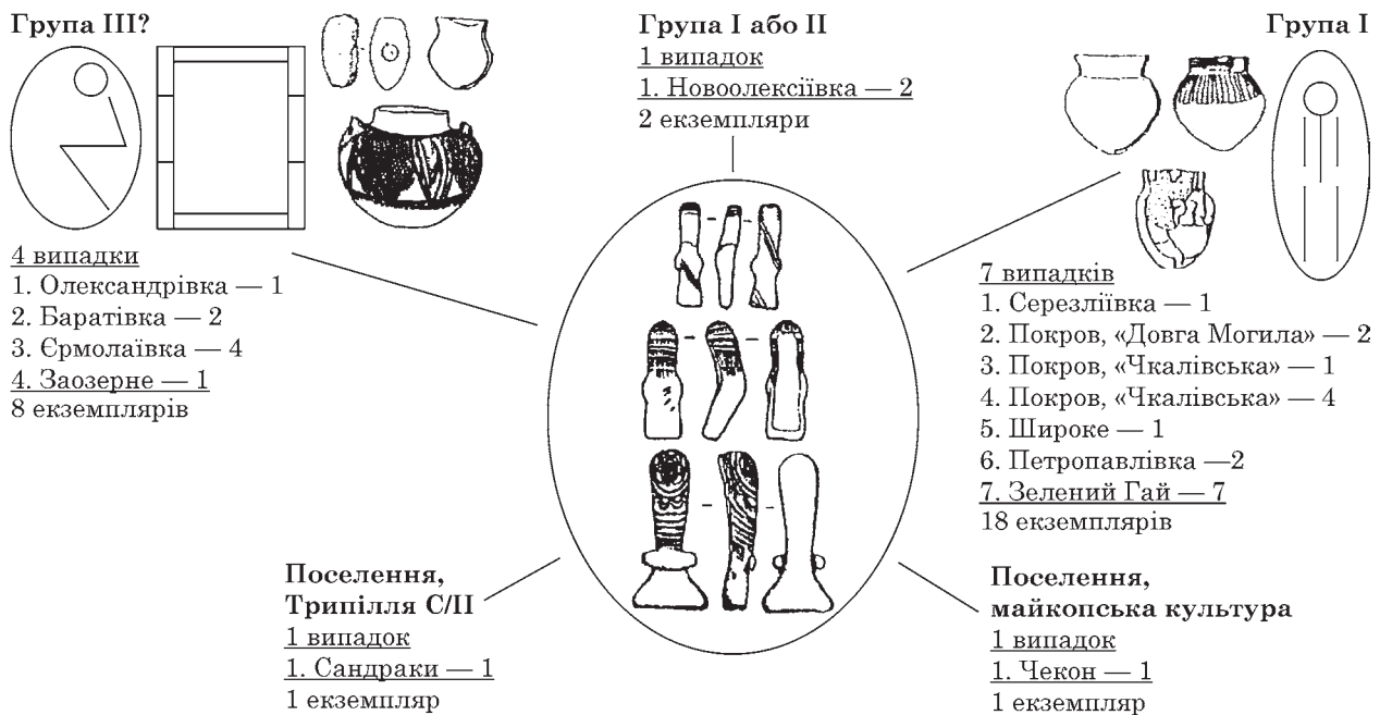
Рис. 4. Контекст знаходження статуєток серезлівського типу (за: Rassamakin 2004a, I, з доповненням)

го чоловіка, двох молодих дівчат та трьох дітей шість з семи статуєток компактно розміщені біля лівого ліктя однієї з молодих дівчат, покладеної на спині з підігнутими ногами, окремо від основної групи похованих (Ковалева 2003b, с. 102, рис. 1; 6: 2). Власне, важливим є і знаходження цього поховання в єдиному хронологічному контексті з аналогічним колективним біритуальним похованням трьох людей (№ 25; рис. 6: 1), а також цілою групою індивідуальних пізньонеолітичних різнообрядових (крім випростаних) скорчених на спині і боці поховань (Ковалева и др. 2003, с. 57—80). Біритуальні поховання, одне з яких випростане, а інше скорчене явище рідкісне і відоме лише в Дніпро-Бузькому межиріччі і тільки в двох випадках, в кургані 9, пох. 3 і 37 групи «Завадські Могили» біля м. Орджонікідзе (сучасний Покров), де дитячі випростані поховання супроводжувалися більш дорослими у скорченому положенні на спині та на боці (Bunjatjan, Kaiser, Nikolova 2006, S. 104—110, Abb. 77: 2; 87: 1). Власне, пізньонеолітичний могильник в зеленогаївському кургані надає нові дані про наявність в регіоні особливого синкретичного локального явища. Найближчим територіально і схожим за наявністю різнообрядових поховань, був курган 1, досліджений Л. Г. Криловою у 1967 р. біля с. Широке на лівому березі Інгульця. В одному з випростаних поховань також була знайдена статуєтка серезлівського типу (Rassamakin 2004a, II, S. 54—55).