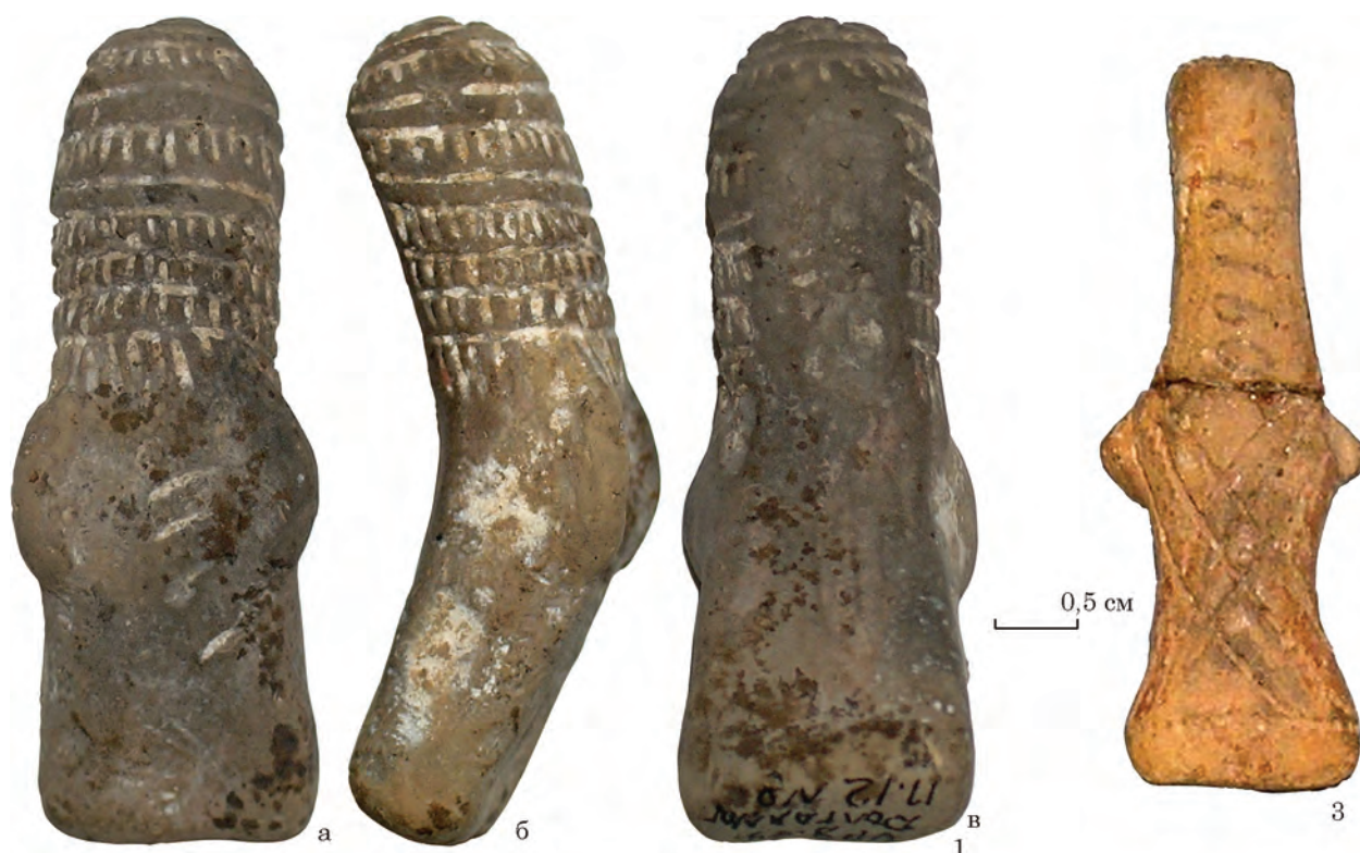
Рис. 5. Приклади трьох варіантів статуеток серезлівського типу Буго-Дніпровського межиріччя: 1 (а—в) — варіант А (Покров), «Довга Могила», пох. 12; 2 — варіант С (Широке, кург. 1, пох. 18); 3 — варіант В (Сerezлівка, кург. 7).