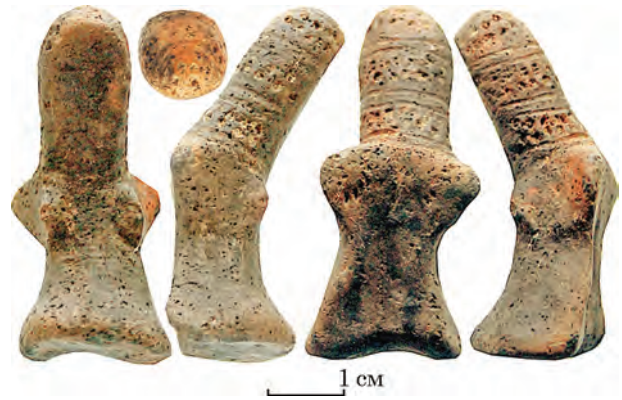
Рис. 1. Статуетка серезліївського типу з майкопського поселення Чекон (за: Юдин, Кочетков 2019)

З відкриттям так званого зеленогайського комплексу і після першої згаданої вище інформації про нього, І. Ф. Ковальова почала активно вводити його у науковий обіг (Ковалева 2002; 2003a). На підставі цього поховального комплексу І. Ф. Ковальова запропонувала своє бачення культурної належності статуеток, розвиваючи свої перші висновки. Найповніше свої погляди вона озвучила 2003 р. (Ковалева 2003b), у книзі, в якій були опубліковані також матеріали кургану 6 (Ковалева і др. 2003, с. 57—80), що було важливим для розуміння стратиграфічного і культурного контексту положення цього поховання (№ 26) в оточенні інших різнообрядових пізньоенеолітичних поховань. По змісту публікація цієї ж статті була повторена дещо пізніше (Ковалева 2005). Власне, стаття автора 2004 р. і стаття І. Ф. Ковальової 2003 р. і визначають на даний момент стан і проблеми у вивченні феномену статуеток серезліївського типу.