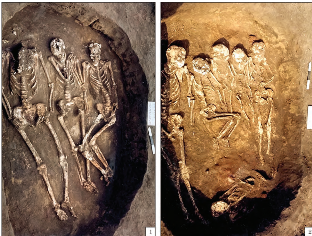
Рис. 6. с. Зелений Гай, курган 6, біритуальні колективні поховання: 1 — № 25; 2 — № 26

Приазов'я, десь у район річок Малий і Великий Утлюки на захід від Молочного лиману? Я розумію, що є певна умовність щодо розміщення пам'яток на досить схематичних картах, але в даному випадку при досить якісній карті такі помилки мені незрозумілі.