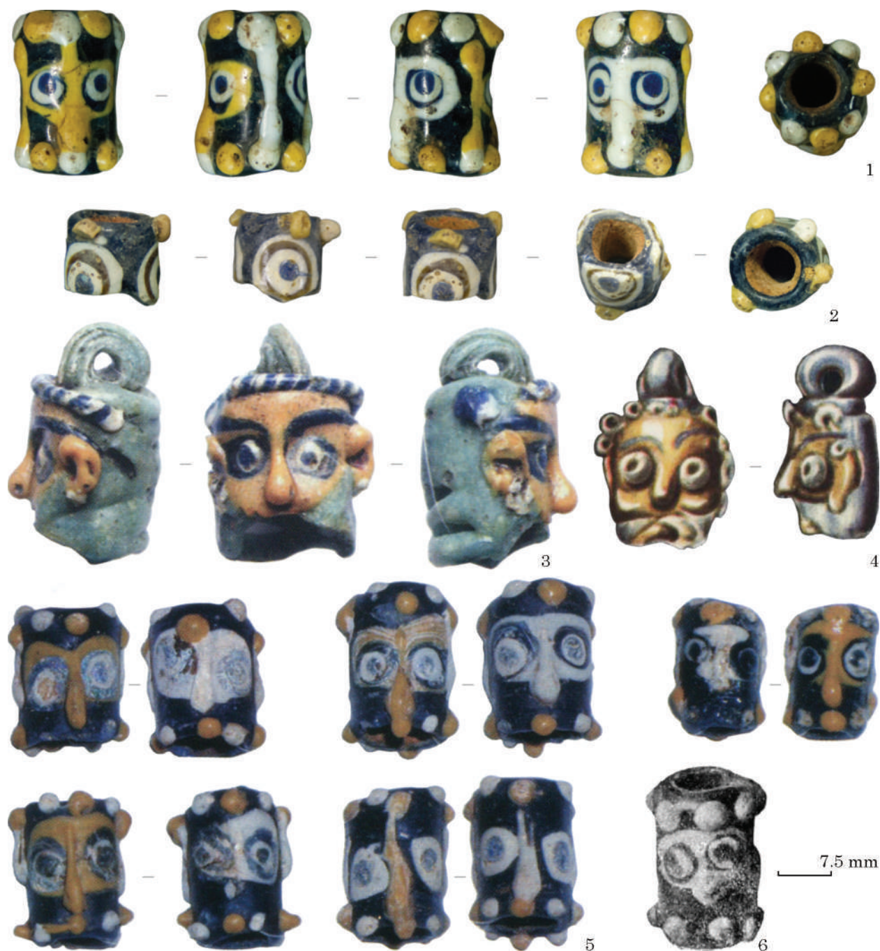
Fig. 2. Beads with masks and pendants with male faces from the Don region and the foothills of South Urals: 1, 2 — Mechetsai, Burial-mound 8/1961, Burial 5; 3 — Elizavetovskoe fortified settlement; 4 — Popov Farmstead, Burial-mound 58/26/1951, Burial 14; 5 — Necropolis of Elizavetovskoe fortified settlement, Burial-mound 133/2002; 6 — Chastye group, Burial-mound 1/1911 (1, 2 — Moscow, State Historical Museum, inv. no. 99564: 1 — list Б 1421/95, 2 — Б 1421/93, photos M. Yu. Treister, 2010; 3, 5 — after Копылов 2006; 4, 6 — Saint Petersburg, State Hermitage: 4 — after Мошкова 1963, 6 — after Замятин 1946)

29, 100—118; Tatton-Brown 1981, p. 143—151, figs. 11—15), represented by various variants in the North (Алексеева 1982, 41, типы 462—463, табл. 47: 10—23. 29; Гороховская, Цыркин 1982, с. 209—210; Кунина 1997, 63, рис. 23—24; 252 (илл.), 254, № 41—44; Dan 2011, p. 221—222) and Eastern (Turmanidze 2007, pl. I: 1; II: 1) Pontic area, were found in particular in the complex of the 4 th century BC at the Elizavetovskoe fortified settlement, the so-called jewel-