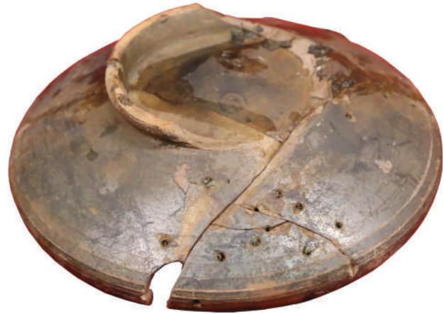
Fig. 4. Zhaiyk I. Burial-mound 1/2019, Burial 1, Black-glazed bowl (Ural'sk, West-Kazakhstan Regional Center of History and Archaeology, photo Ya. A. Lukpanova)

Burial-mound 25/1983 of the Koldyri group near the village of Krasnoe Znamya on the left bank of the Manych river together with the Chersonesian amphora of type IB, according to S. Yu. Monakhov's classification, dating to the last quarter of the 4 th century BC (fig. 3: 5) (Лукьяшко 2000, с. 177, рис. 9: 4).