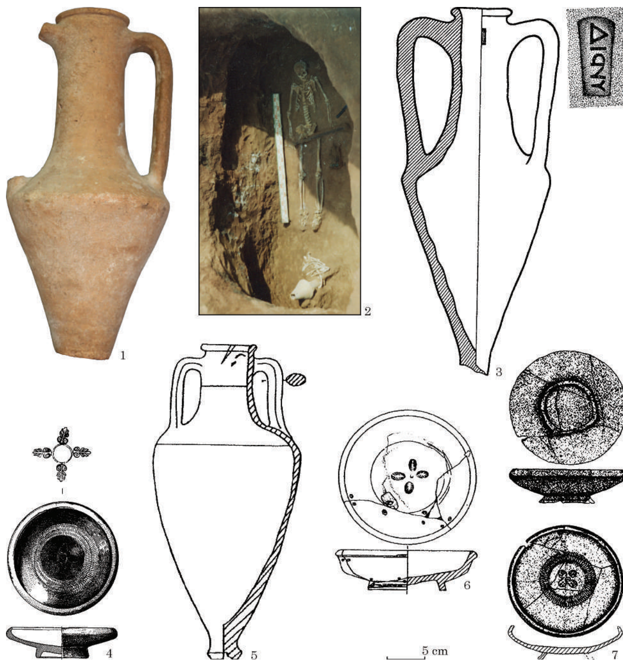
Fig. 3. Greek pottery of the late 4 th — first quarter of the 3 rd century BC from the Manych, Lower Volga basins and the foothills of South Urals: 1, 2 — Novo-Musinskii cemetery, Burial-mound 3/1999, Burial 1; 3, 4 — Krivaya Luka VI, Burial-mound 1/1973, Burial 14; 5, 6 — Koldyri Group, Burial-mound 25/1983, Burial 1; 7 — Zhaiyk I, Burial-mound 1/2019, Burial 1. 1, 3, 5 — Amphorae; 2 — the view of the burial; 4, 6, 7 — Black-glazed bowl. 1 — Sterlitamak, The Branch of the Bashkirian State University. Repository of the Educational and methodological Cabinet of Archeology of the Department of World; 3, 4 — Astrakhan' State Joint Historical-Architectural Museum-Reserve: 3 — acq. no. 19358, A-9999, 4 — acq. no. 22694, A-10334; 5—7 — Ural'sk, West-Kazakhstan Regional Center of History and Archaeology. Photos: 1 — V. N. Vasil'ev, 1999; 2 — S. V. Sirotin, 2016; Drawings: 3, 4 — after: Дворниченко и др. 1977; 5, 6 — after: Лукьяшко 2000; 7 — after: Лукпанова 2020

and with four palmettes in the center: Krivaya Luka VI, Burial-mound 1/1973, Burial 14 (fig. 3: 4) (Дворниченко и др. 1977, с. 67, рис. 71; Брашинский 1980, с. 105; Клепиков 2007, с. 41, рис. 15; Шинкаръ 2012, с. 194, рис. 2: 2; с. 195); Zhaiyk I, Burial-mound 1/2019, Burial 1, with holes along ancient cracks — traces of ancient repairs (not mentioned by the author of the publication, but clearly visible in the drawing published